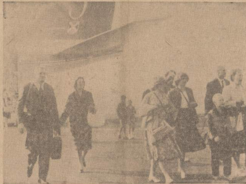
Belgijos Kongo kolonistai atskrido į Bruselio aerodromą iš Leopoldville, Belgijos Kongo. Tai pirmoji belgu grupė, kuri aplėdo tą Afrikos koloniją. Birželio 30 d. Belgijos Kongo atgaus nepriklausomybę. Sentimentas tarp vietos gyventojų baltodžių kolonistų atžvilgiu yra gana nepalankus. Baltodžiai tad ir skuba iš ten pasprukti.

MEKSIKOS MIESTAS. — Kubos prezidentas Dorticos apvažinėjo penkias Pietų Amerikos respublikas, sakydamas kalbas prieš Ameriką, ir ketvirtadienį atvyko į Meksikos sostinę, kur jį pasitiko 15,000 žmonių minia. Meksikiečiai šaukė: "Kuba — taip. Amerika — ne". Ji pasitiko Meksikos prezidentas Adolfo Lopez Mateos, kuris perreitalis metais svečiavosi pas prezidentą Eisenhowerį ir nuda-vė esąs didelis Jungtinių Valstybių draugas.