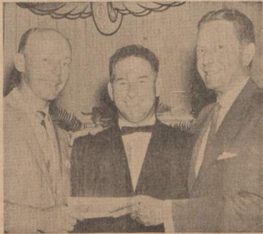
Jim Rathman (kairėje), kuris Indianapolisje įvykusiose automobilių lenktynėse laimėjo pirmą vietą, laiko jam įteiktą čekį $110,000 sumai. Tai jo laimėjimo prizas.