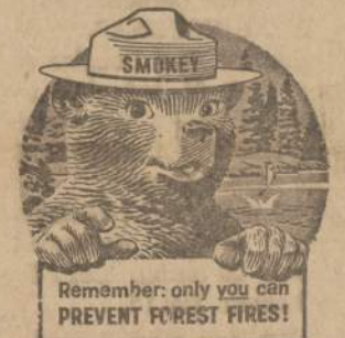
Remember: only you can PREVENT FOREST FIRES!

kiekvienas ir apie viską. "NAUJENOSE" gali rašyti!