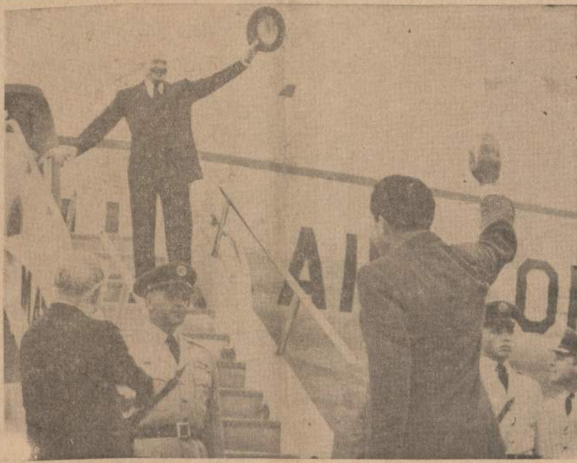
Viceprezidentas Richard Nixon (dešinėje), mokiuodamas ranka atsivėikina su prezidentu Eisenhoweriu, kuris iš Andrews aerodromo (Md.) išskrido į Aliaską, o iš ten į Tolimus Rytus.

Jie nurodo, kaip drąsiai pasielgė Dominikos visi šeši vyskupai, kurie savo ganytojiškuose laiškuose pasmerkė Trujillo diktatūros žiaurymes. Jie cituoja popiežiaus Pijaus XII žodžius, pasakytus 1950 m. vasario 18 d. apie žodžio ir spaudos laisvę. Mūsų policijos stotyse naudoja tortūras prieš piliečius, kurie dažnai nėra kalti nei tuo, kuo policija juos kaltina, rašo Baskų kunigai savo vyskupams, ragindami juos ką nors daryti prieš Franco valdžios žiaurumus.