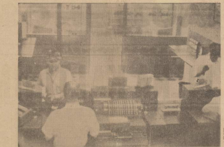
Du banditai neįtaria, kaip automatikas įrengeimas juos nufotografavo beslėpiančią vieną Savings & Loan Association Newark, N. J. Pagal šią nuotrauką dabar FBI pradėjo plėšikų medžioklę visame krašte.