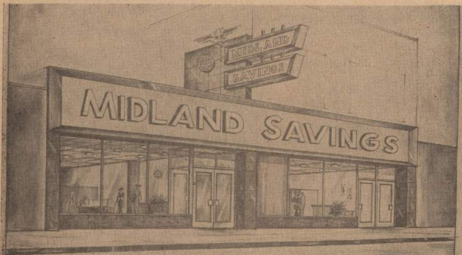
Naujo Midland Savings and Loan Association pastato projektas, padarytas Chicago Bank Building and Engineering Co. Statybą vykdo Jonas Stankus Construction Co. Namas statomas Archer ir California gatvių sankryžoje.

TAUPLYKITE TEN, KUR MOKAMAS AUKŠČIAUSIAS DIVIDENDAS