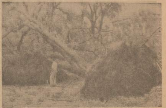
Virginia, Ill. apylinkėje tornado išrovė daug medžių ir apgriovė eilę namų.