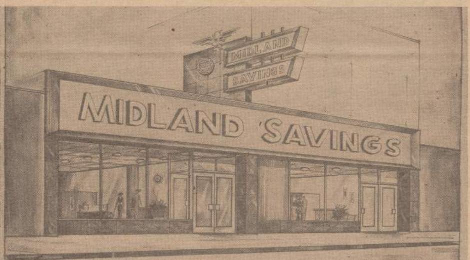
Naudojama Midland Savings and Loan Association pastato projektas, padarytas Chicago Bank Building and Engineering Co. Statybą vykdo Jonas Stankus Construction, Co. Namai statomas Archer ir California gatvių sankryžoje.

Sole Distributors: COLONIA, Inc., 41 East 42 St., New York City 17.