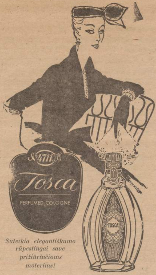
Suteikia elegantiskumo rūpestingai save prižiūrinčioms moterims!