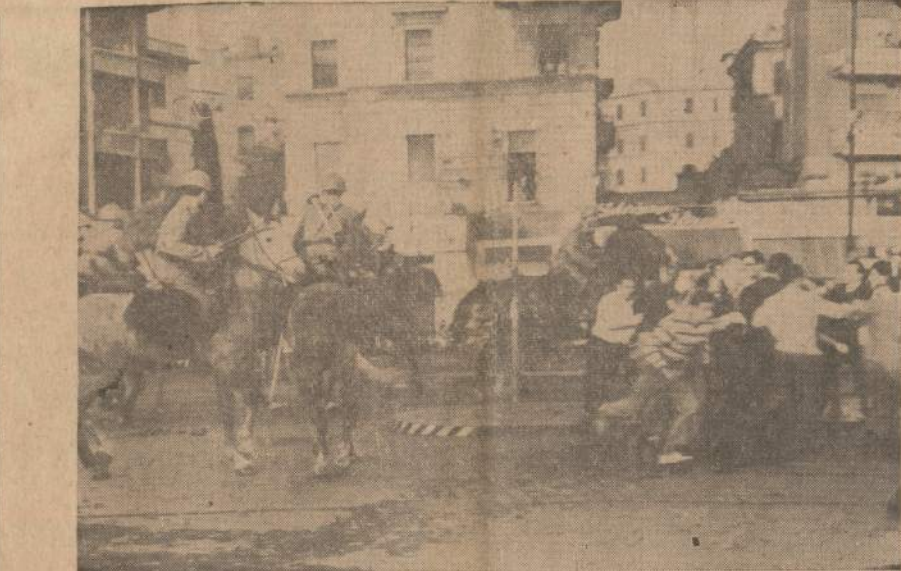
Raita policija atakuoja maištaujančius komunistų demonstruotojus Romoje, kai buvo uždraustas įėjimas daryti viešas mitingas.

Peru respublikos vyriausybė paruošė dokumentą, išdėstydama pažiūras, visiškai panašias į Washingtono vyriausybės, kad Chruščevo nuolatinis brovimasis į Jungtinių Valstybių-Kubos santykius kelia pavojų visoms Lotynų Amerikos erspublikoms. OAS susideda iš 21 respublikos: Jungtinių Valstybių ir 20 Lotynų Amerikos šalių, tarp jų ir Kubos.