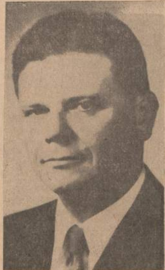
Senatorius T. B. Morton iš Kentucky pasakys pagrindinę kalbą Žalgirio mūšio ir Dariaus-Girėno skridimo minėjime, sekmadienį, liepos 17 dieną prie Dariaus-Girėno paminklo.