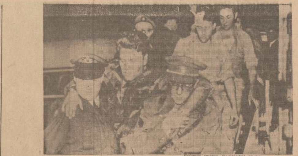
Suteikti Belgijos parašutinkai gražinami į Brukselį iš Kongo, Afrikoje, kur buvo iškurtas išsigimti ginklų baltųjų nuo sukultūro vietinių smurto. Rūšims tvarkyti Jungt. Tautų Saugumo Taryba įgaliojo gen. sekretoriui Dag Hammarskjöldą skubiausiai siųsti į Kongo karinę JT įėgą, sudarytą iš laisvų Afrikos respublikų.

Atstatyti Lietuvos nepriklausomybę reikėtų ne skaldyti Sovietų Sąjungą, o tik atitaisyti neteisėtumą, kurį padarė Stalinas, susitaręs su Hitleriu.