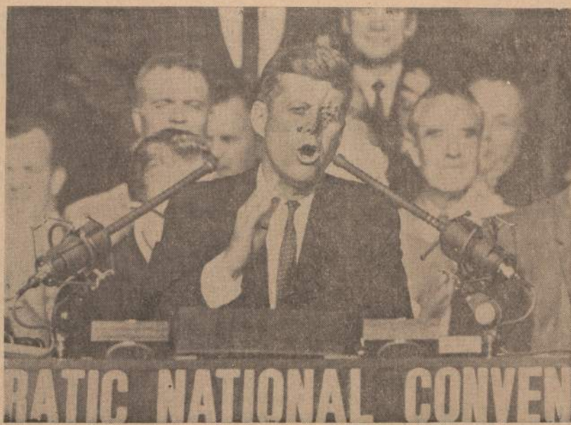
Senatorius John F. Kennedy (demokratas iš Massachusetts), nominuotas kandidatu į JAV prezidentus, dėkoja demokratų partijos nacionalinei konvencijai Los Angeles už jo nominavimą.

"Sovietinė propaganda ir politika laikosi strategijos, kurios tikslas apsupti priešą netik geografiniai, bet ir dvasiniai (ideologiniai). Visos so-