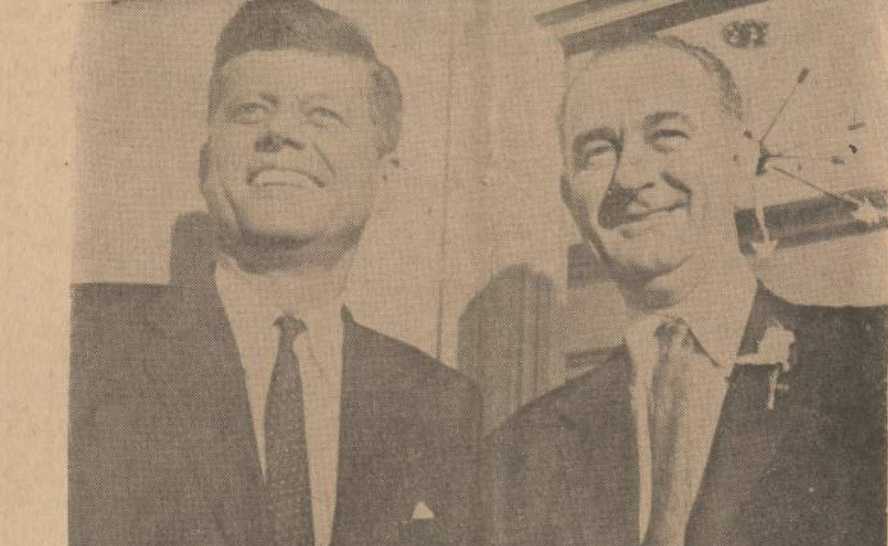
Demokratų partijos kandidatai: kairėje sen. John F. Kennedy, kandidatas į JAV prezidentus; dešinėje — sen. Lyndon B. Johnson iš Texas, kandidatas į viceprezidentus. Juos kandidatais nominavo Demokratų nacionalinė konvencija, kuri įvyko Los Angeles mieste.

STOCKHOLMAS, švedija. — Iš Sovietų keleivinio laivo "Estonia" pabėgo 10 lenkų, priklaususių komunistų ekskursijai į Vakarų Europą. Laivui išplaukus, jie prisistatė švedų policijai ir paprašė leidimo pasilikti.