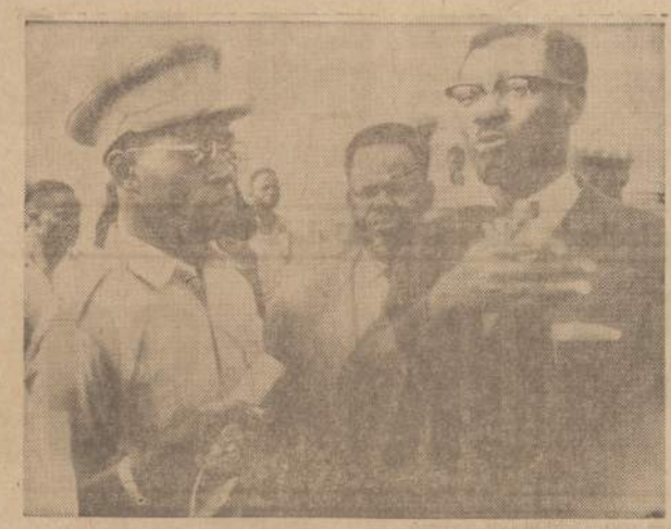
Kongo premjeras Patrice Lumumba (dešinėje) kalbasi Leopoldville mieste su Joseph Mobutu, naujuoju Kongo armijos vadu.

2 — NAUJENOS, CHICAGO 8, ILL. — WEDNESDAY, JULY 20, 1960