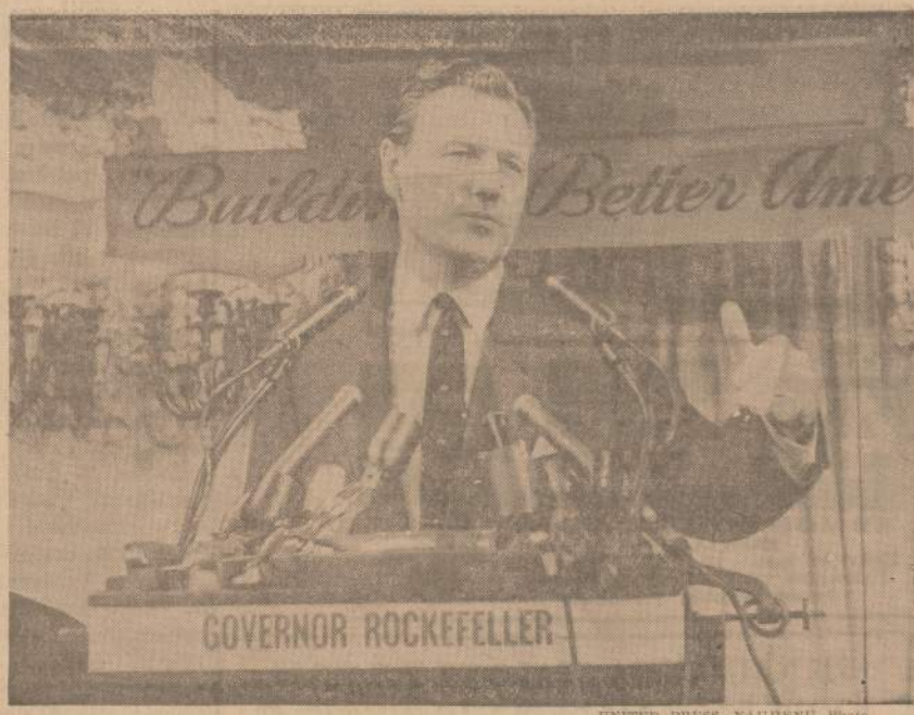
New Yorko gubernatorius Nelson Rockefeller skatina respublikonų platformos komiteta Chicagoje priimti tokią programą, kuri visur sustiprintų demokratiją ir pakeltų šio krašto gynybą ir ekonomiką.

Tik dabar Žilys sugalvojo tokią atestaciją, nes dar yra šimtai gyvų liudininkų, kurie žino,