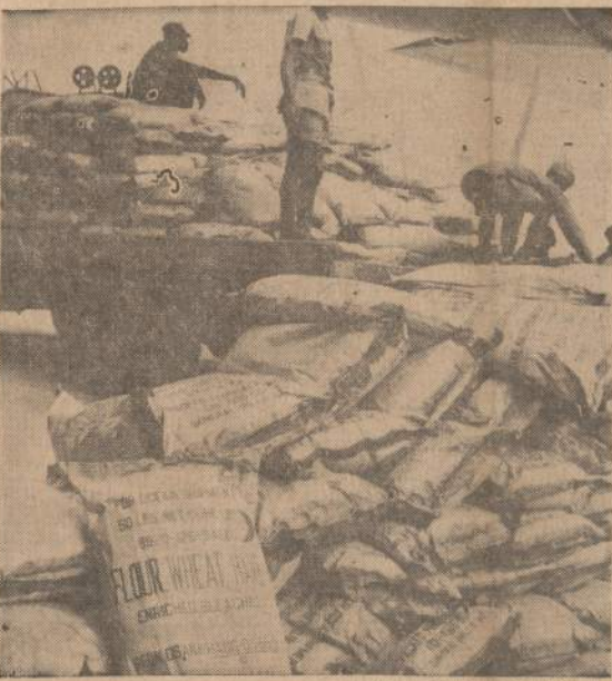
Pirmieji maišai su miltais, kaip Jungtinių Tautų dovaną, JAV lėktuvas atgabenti iš Europos į Kongo ir iškraunami Leopoldvilės aerodrome.

JAV vyriausybė neskelbia, kas buvo jo agentu, kuris pridarė iš lėktuvo špionąžo nuotraukų. Kalbama, kad jis laiku paspruko iš Amerikos į užsienį.