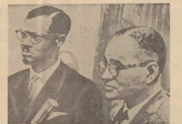
Kongo premjeras Patrice Lumumba (kairėje) stovi greta Jungtinių Tautų įgaliojimo Dr. Ralph Bunche per spaudos konferenciją Leopoldvilleje. Lumumba vis tebeprasina, kad jis pasiūks sovietų raudonąją armiją, jei belgai neapleis Kongo lučtuojau.