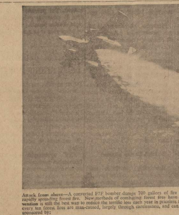
Attack from above—A converted F7F bomber dumps 700 gallons of fire retarding borate slurry on a rapidly spreading forest fire. New methods of combating forest fires have helped enormously but prevention is still the best way to reduce the terrific loss each year in priceless forest resources. Nine out of every ten forest fires are man-caused, largely through carelessness, and can be prevented. This message sponsored by: