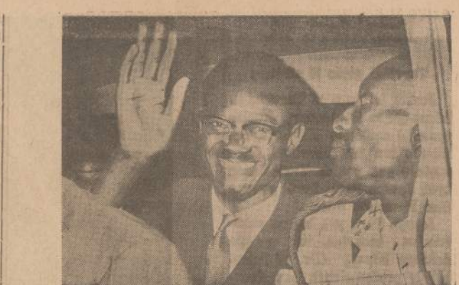
Kongo premjeras Patrice Lumumba patenkintai šypsoi, atskridęs iš Afrikos į New Yorką pasitarti su Jungt. Tautų generaliniu sekretoriumi Dag Hammarskjöldu, kaip greičiau baigus smurtą ir riaušes jaunoje Kongo respublikoje.