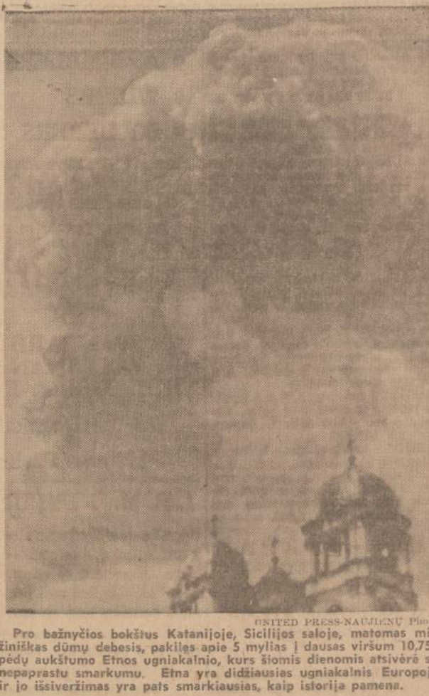
Pro bažnyčios bokštus Katanijoje, Sicilijos saloje, matomas milžiniškas dūmų debesis, pakilęs apie 5 mylias į dangaus viršum 10,758 pėdų aukštumo Etnos ugniakalnio, kuris šiomis dienomis atsivėrė su nepaprastu smarkumu. Etna yra didžiausias ugniakalnis Europoje ir jo išsiveržimas yra pats smarkiausias, kaip istorija pamena.

Atsibunda vyras lygiai aštuntą valandą ir iš pykčio vos besulaiko liežuvį. Žiūri, prie jo lovos padėtas raštelis, kuriame parašyta: "Kelkis! lygiai ketvirtą valandą."