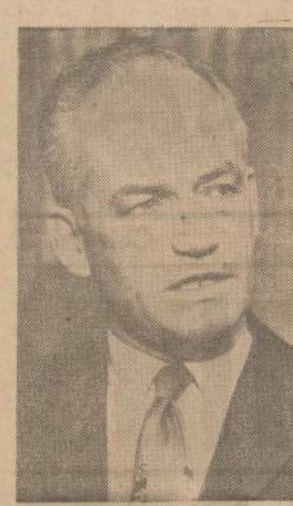
Senatorius Barry Goldwater (resp. iš Ariz.) sako, kad tarp Nixono ir Rockefellerio sudarytoji sutartis dėl sumokėjimo Rockefelleriui, kad šis sutiktų būti nominuoti į viceprezidentus. Bet tai esąs tik paties Goldwaterio asmeninis nuajutimas, jokiais faktais neparemtas.