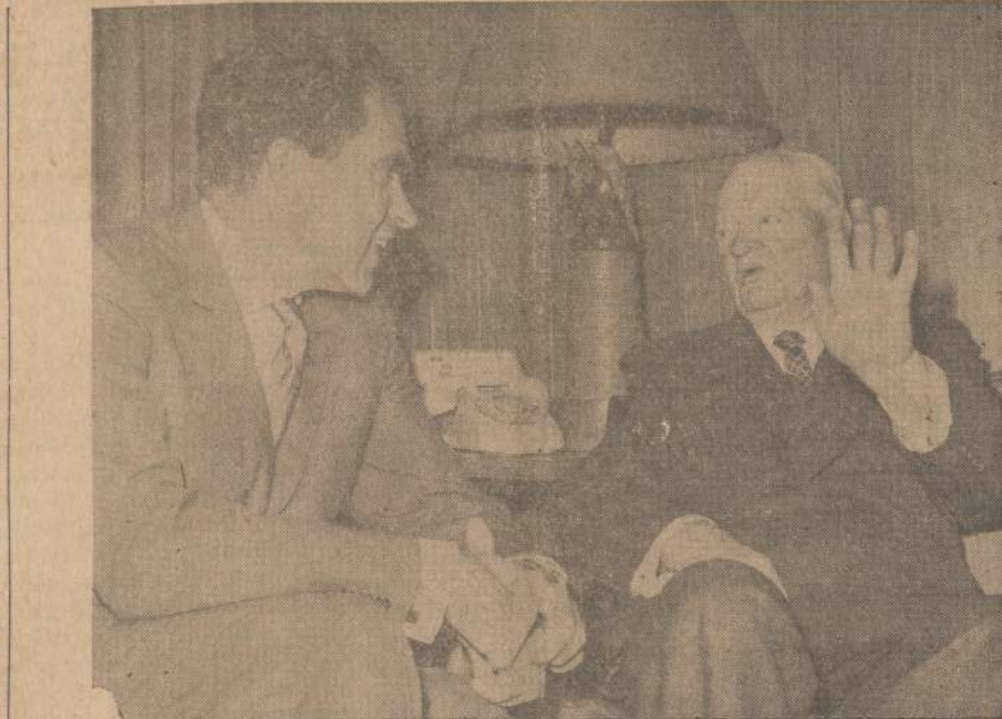
Viceprezidentas Richard Nixon atidžiai klausosi, kai buvus prezidentas Herbert Hooveris kalba respublikonų konvencijoje Chicagoje. Hoover pareiškė viltį, kad respublikonai išvesią JAV iš "pabaisėtinos moralinės balos".