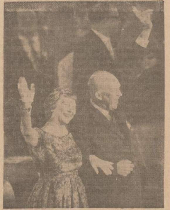
Jungtinių Valstybių prezidentas ir jo žmona sveikinami čikagiečių atvykus į respublikonų partijos 1960 metų konvenciją.

Kas yra pamfletas? Bet kurį žodį paėmus (šiuo atveju American College Dictionary) yra pasakyta: Pamflet 1. a short treatise or essay, generally controversial, on some subject of temporary interest; 2. a complete publication generally less than 80 pages".