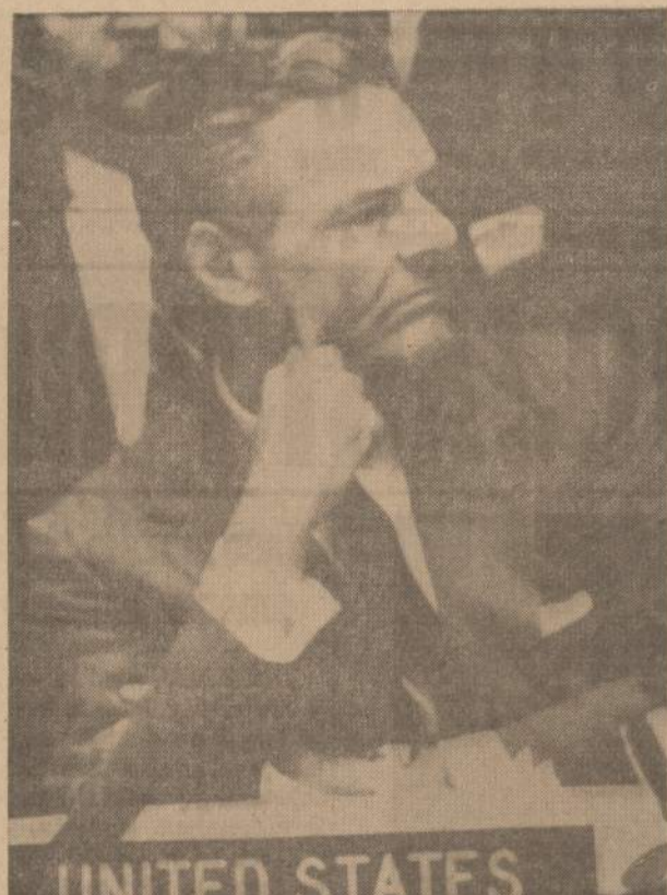
JAV ambasadorius Jungtinėse Tautose Henry Cabot Lodge, Ni-xono pasirinktas kandidatas į viceprezidentus, respublikonų konvencijos metu pirmomis dienomis negalėjo dalyvauti, nes turėjo ginti JAV nuo sovietų užpuolimų Jungtinėse Tautose New Yorke.

Ji, pusiau negyva iš baimės, desperatiškai įkibo į jo kojas. Kiekvienas jos nervas virpėjo, kaip įtemta styga. Bet jos baimė ir maldavimai dar labiau įsitino direktorių.