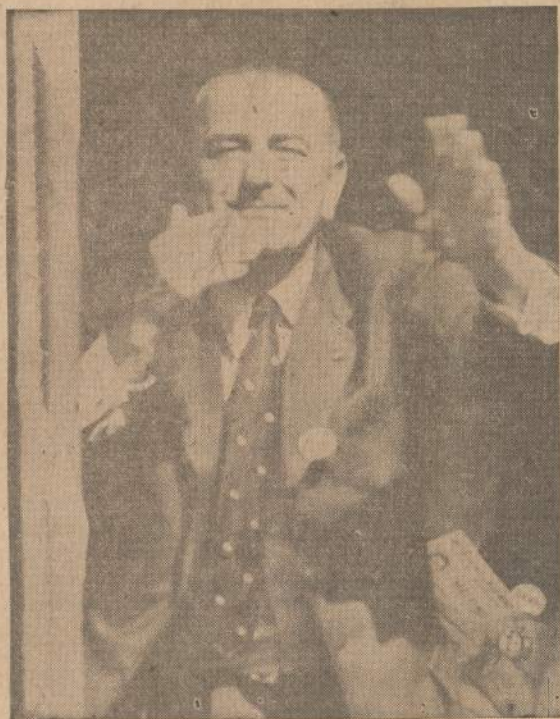
Senatorių Lyndon B. Johnson, kurį demokratai nominavo viceprezidento postui, Monticello, Iowoje, pasakė labai kantiškas respublikonių administracijos atžvilgiu kalbą, kurios pasiklausyti susirinko 12,000 žmonių.