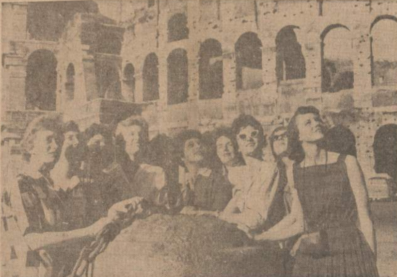
Iowa universiteto orkestras apžiūrinėja Romą. Orkestras lanko įvairias Vakarų Europos valstybes.

ASUNCION, Paragvajus. — Argentinos pasienio sargybiniai ištraukė iš Paranos upės 17 lavonų nukautų revoliucionierių. Jie atvyko iš Argentinos (Paragvajaus politiniai pabėgėliai) ir bandė įsibrauti į Paragvajų ir sukelti revoliuciją. Paragvajus jau yra atmušęs kele-tą tokių įsibrovimų.