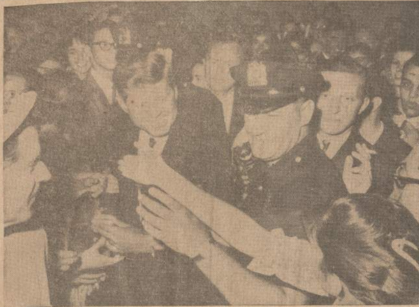
John F. Kennedy, demokratų kandidatas į JAV prezidentus, prie Time and Life trolebio New York, kur jis atvyko pasitarti su Time ir Life žurnalo vyriausiu redaktorium, Henry Luce. Prie trolebio Kennedy buvo sutiktas didelės žmonių minios.

Nuo Fidel Castro valdžios pasitraukė dar vienas Kubos diplomatas, prekybos attache Vakarų Vokietijoje.