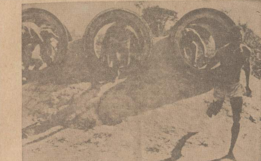
Nuo Kongo atsimefiusis ir nepriklausoma pasiskelbusios Katangos provincijos jauni savanoriai mokosi ginti savo kraštą nuo Kongo premjero Lumumbos, kurs rengiasi atsimefiusią provinciją ginklu priversti grįžti į priklausomybę Kongui.

Washington komentuojama kitaip. Tai tik buvęs atsikėrimas už ištrėmimą Sovietų ambasados trečiojo sekretoriaus, kuris davė $1000 vienam fotografui, kad padarytų iš lėktuvo Amerikos miestų ir karinių įrengimų fotografijas.