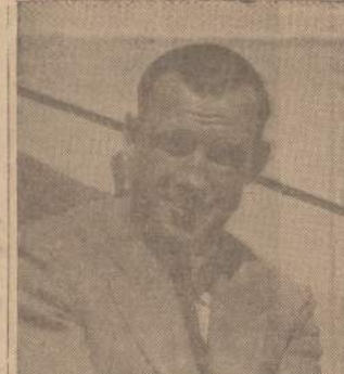
Jungt. Tautų gen. sekretorius Dag Hammarskjöld rimtai perspėjo Sąjungo Tarybą New York, kad gali kilti trečias pasaulinis karas, jei bei gai neišsikraustys iš Kongo kaip galima greičiau.

Markso lauktos kapitalo koncentracijos kelių kapitalizmo perėjimas neina Markso nurodytu keliu. Vietoje Markso lauktos kapitalo koncentracijos kelių kapitalizmo perėjimas neina Markso nurodytu keliu.