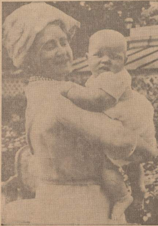
Anglijos karalienės motina paminėjo 60 metų amžiaus sukaktį. Ji laiko jauniausią anūką, princą Andrew.