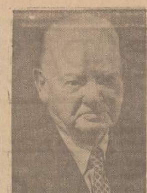
Buvęs prezidentas Herbert Hoover. Ši nuotrauka buvo padaryta New York'e, kai ryšium su jo 86 metų amžiaus sukaktimi buvo daromas pasikalbėjimas (interviu). Jis dar ir dabar dirba 10 valandų per dieną, ruošdamas keturių tomų milžinišką veikalą "An American Epic". Laiko jis asūnuis sekretoriuis.