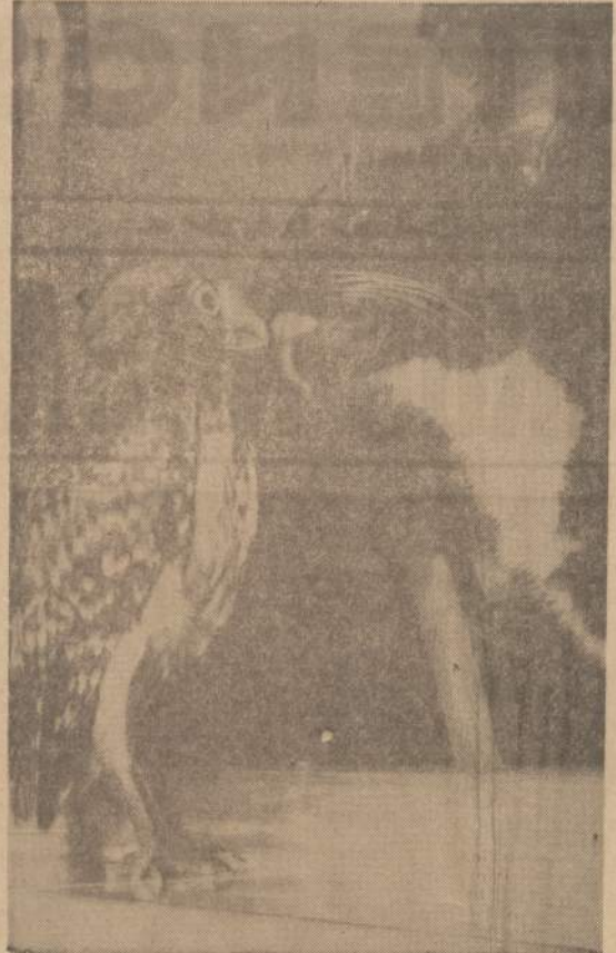
Atrado, kad "Blinky" pelėda labai gražiai sugyvena su "Boots" katinu. Bet tai tik taip atrodo, nes juos skiria langostiklas. Prijaukinta pelėda yra viduje, o katinas lauke. O vieta—West Palm Beach, Floridoje.

Nors pripažįstama, kad šiame atradime yra kas nauja, bet riebalams dar per anksti džiaugtis ir gali praeiti eilė metų kol tie vaistai bus išvirti.