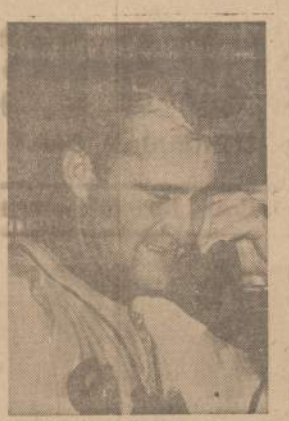
Lew Burdett, Milwaukee Braves komandos "pitcher", laimėjęs 1:0 rezultatu prieš Philadelphia Phillies, kalbasi telefonu su savo žmona.

Užsakymus adresuokite. NAUJIENOS 1739 S. Halsted Street Chicago 8, Ill