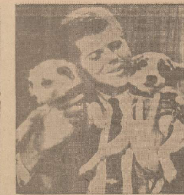
Van Clyburn, Amerikos pasižymėjęs jaunuolis pianistas iš Texas, šiuo metu koncertuoja Maskvoje, laiko rankose pora sūniukų Beika ir Strelka, ką tik grįžusių iš erdvių kelionės.

Molotovas pateikė Aukščiausiam Sovietui Maskvoje naują sutartį su Lietuva, pasirašytą 1939 m. spalio 10 d., ir, prašydamas ją patvirtinti, sakė, kad tik "antivieliniai priešai" gali skelbti prasimanymus, jog