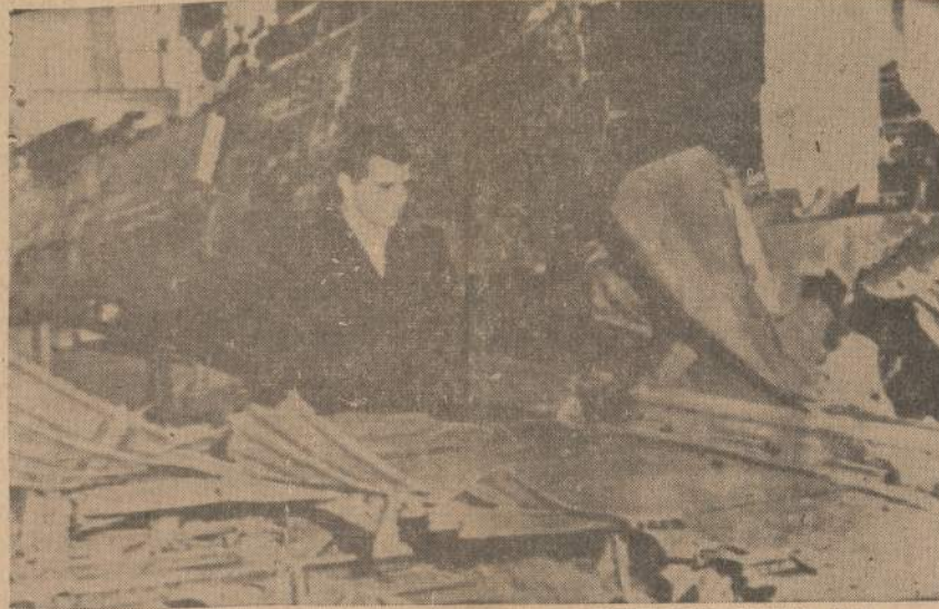
U-2 pilotas Francis Powers, nuteistas 10 metų sovietų kalėjimo, žiūri į savo lėktuvo lauką, išstatytą parodai Gorkio parke Maskvoje.