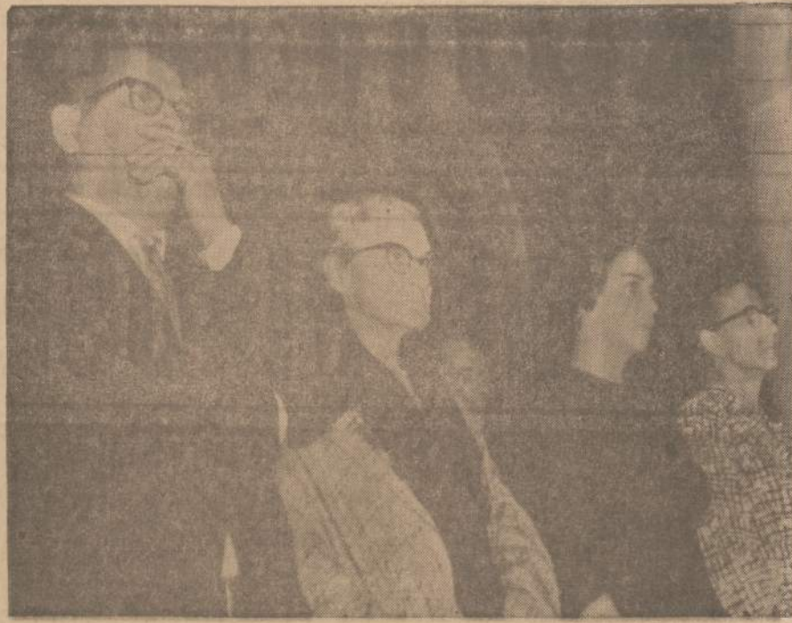
U-2 lėktuve piloito Francis G. Powers šeima Maskvos kariuomenės teismo klausosi teismo sprendimo, kuriuo Powers buvo nuteistas 10 metų bausme — 3 metus kalėjime, septynis darbo vergų stovyklos.

Komisija prieš kiek laiko įteikė SLA vadovybei savo ra-