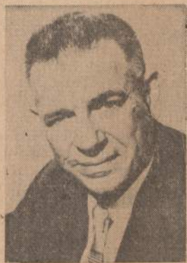
Oscar Hammerstein II, vienas žymiausių muzikinių veikalų gamintojų mirė vėžio liga savo farmoje arti Doylestown, Pa. Jis yra pagaminęs "Showboat", "South Pacific" ir t. t.

O jos 12 metų sūnus kaimą labiau mėgsta, negu motina. Vaikui patinka rūkštus pienas, lietuviškai gamintas sūris ir ūkio galvijai. Jeigu ne mokykla, tai jis visą laiką būtų ūky-