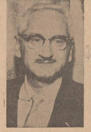
Dr. Albert Sabin, kuris išrado naują skiepius prieš polio. Skiepai yra pagaminti iš gyvų polio virusų ir paaimami per burną. Dr. Sabin yra amerikietis profesorius iš Cincinnati. Daugelis kraštų ištyrė Dr. Sabino skiepius ir rado, kad jie labai tinkami. Naujaisiais ir JAV vyriausybė juos pripažino tinkamais naudoti apsaugojimui nuo polio.

Pirmadienį. Darbo Dieną, NAUJIENOS neisės ir ofisas bus uždarytas. NAUJIENOS