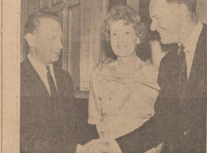
JT sekretorius Dag Hammarskjöld (kairėje) sveikina su Henry Cabot Lodge ir jo žmona atsisveikinimo pobūvyje, kuris buvo surengtas New York'e. Pobūvis buvo surengtas pagerbimui Lodge, kuris rezignavo iš JAV ambasadoriaus pareigų Jungtinėse Tautos.

— Aš? O aš... neskaitysiu, skaityk tu... aš — ne savo kailyje... taip! „Pamynė mane ma-