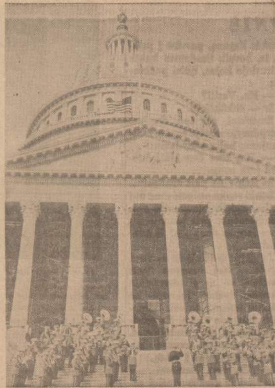
Washingtonė baigus statyti Kapitolio rytinį priestatą, viršum jo iškilmingai iškeliama Jungtinių Valstybių vėliava.

Netolima ateitis parodys, ar JAV siūloma Lotynų Amerikai ekonominė pagalba yra pakankama ir ar ji pasiūlyta nepavėluotai, kad padėtų sulaikyti ir pašalinti, anot prezidento Lleras, gresiantį ekonominį chaosą.