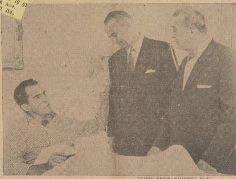
Senatorius Lyndon Johnson (dem. iš Texas), Senato daugumos vadas (centre) ir Senato mažumos vadas Everett Dirksen (resp. iš Illinois, dešinėje) kalbasi su Richard Nixono ligoninėje, kur Nixon buvo paguldytas su sužeistu keliu.

— Earl Long, ilgametis Louisianos gubernatorius, mirė nuo širdies ligos 65 metų amžiaus. Perekaitis metais Earl Long buvo šeimos narių uždaręs psichiatrinę ligoninę.