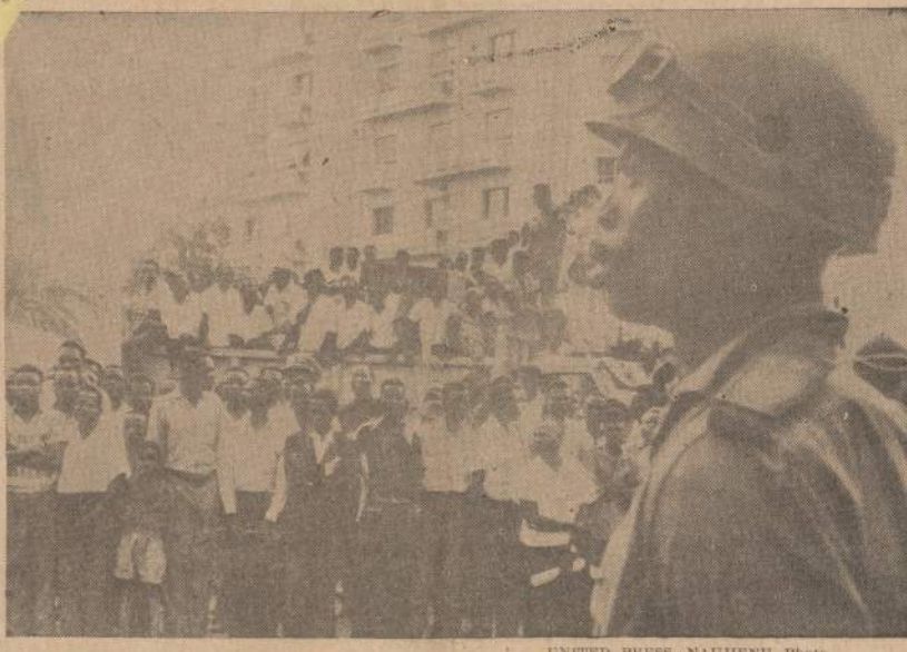
Chana valstybės karys, vienas iš 14,000 karių, sudaryti iš 10 valstybių, seka kongoliečių demonstraciją Leopoldvillės mieste.

Anglų dienraštis Daily Mail skelbia, kad Belgija pastarosiomis dienomis pasiuntė į Katangą 100 tonų ginklų (šautuvų, kulkosvaidžių, granatsvaidžių). Ji perleis Katangai 25 lėktuvus, 80 belgų karininkų vadovaujančią Katangos kariuomenę, prie kurios savanoriais prisirašę 300 belgų veteranų-parašiū-