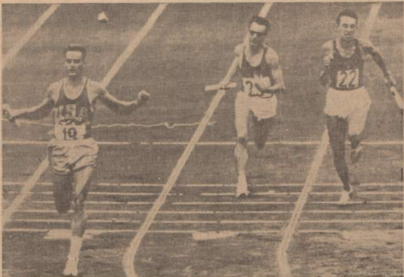
Dave Sime (kairėje) olimpinėse rungtynėse Romoje atbėga pirmas, italias Livio Barruti (viduryje) — antras ir sovietu E. Ozolin (dešinėje) — trečias. Baigimines bėgimo rungtynes Sime laimėjo iš Vokietijos Martin Lauer. Tačiau Sime buvo diskvalifikuotas už sulaužymą taisyklės, — perbėgimo draudžiamos linijos. Dėlei to Sime pralaimėjo rungtynes ir aukštinį medalį.