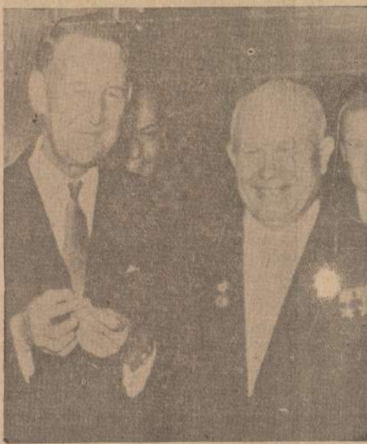
Sovietų premjeras Nikita Chruščiovas (dešinėje) stovi šalia JAV ambasadoriaus Llewellyn Thompson diplomatų priėmimo Maskvoje.

Raportė sakoma, jog sovietų gaminami įrankiai ir mašinos nėra moderniškai ir negali susilyginti su Amerikoje ir Europoje pagaminamais.