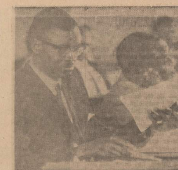
Kongo premjeras Patrice Lumumba rengiasi kalbėti senato posėdyje, Leopoldville mieste.