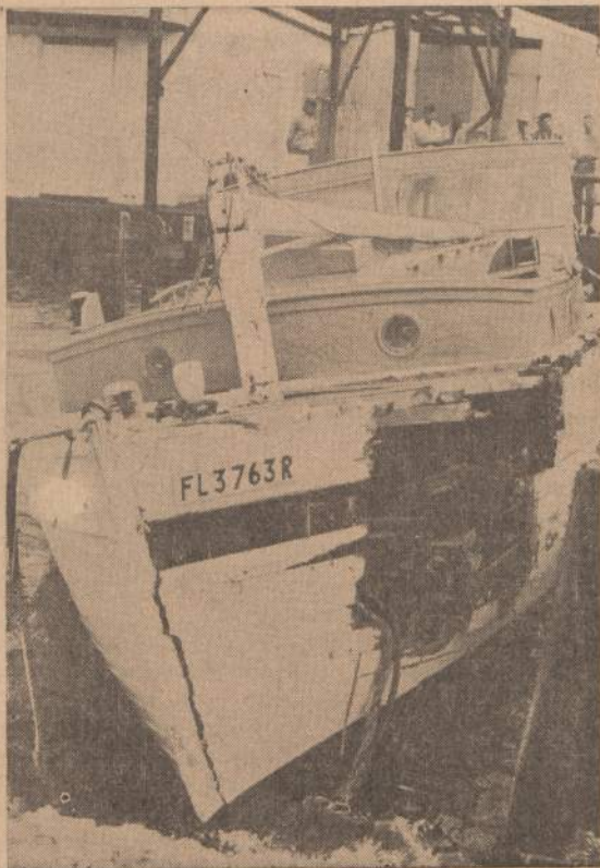
Uragano Donna sudaužytas ir paskandintas prie Riviera Beach vienas 48 pėdų kreiserinis būrlaivis.