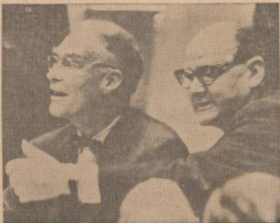
AMERICAN SECRETARY OF STATE CHRISTIAN HERTER (Kairėje) ir JAMES WADSWORTH, JAV ambasadorius Jungtiniams Tautoms, apžiūri JT generalinės asamblėjos salę.

Dabar Cat-Mackevičius buvo užsidedęs Didžiosios Lietuvos Kunigaikštystės tradicijų atgaivinimui ir pritaikymui jų naujiems laikams. Jis įrodinėjo man, kad Vilniaus prijungimas prie Lietuvos esąs reikšmingiausias istorinis įvykis lietuvių ir lenkų istorijoje ir kad sudaręs puikiausią progą Didžiosios Lietuvos Kunigaikštystės koncepcijos atgaivinimui. Lietuviai esą turėtų suprasti, kad ta kunigaikštystė nebuvo nacionalistinė, kurioje reišėsi ir gyveno tikta viena etninė grupė, bet darnus konglomeratas įvairių tautybių ir kad tas tolerancijos