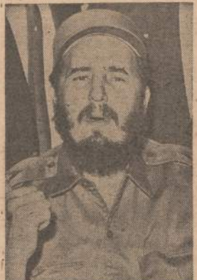
Kubo premjeras Fidel Castro ap-lieido Shelburne viešbutį New York-e. Pranešama jė padarė spaudos atsto-vams viešbučio valgomajame kamba-ryje. Girdi, viešbučio vadovybės są-lygos jam esančios nepriimtinos.

5 — NAUJIENOS, CHICAGO 8, ILL. — SATUR., SEPTEMBER 24, 1960