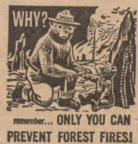
remember... ONLY YOU CAN PREVENT FOREST FIRES!

Ar tvarkoj elektros įrenginiai? Vielų pravedimas ir elektriniai šildy-mai — mūsų specialybė. Mes jums parodysime kaip turėti daugiau nau-dos iš elektros. Turime Electric As-sociation leidimą. Žemos kainos na-mų savininkams. Skambinkite RE 5-5757 — PO 7-3248 Airport Electric Co. 6342 S. Central A.