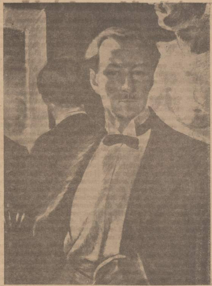
Prof. Justinas Vienožinskis — Autoportretas 1934 m.

Justinas Vienožinskis aiškiau pėrmatė ko lietuviškai mokyklai stokoja — tinkamo auklėjimo, iš pačių mokytojų reika-