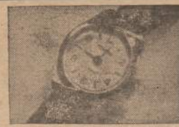
MOTERISKI IMPORTUOTI LAIKRODELIAI

BIZNIERIAI, KURIE GARSINASI "NAUJIENOSE" — TURI GERIAUSIĄ PASISEKIMĄ BIZNYJE — GARSINKIS IR TU