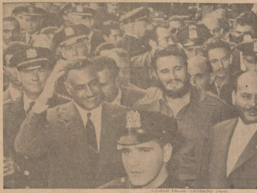
Gamal Abdel Nasser, Jungtinės Arabų Respublikos prezidentas, stovi šalia Kubos premjero Fidel Castro, prie jo viešbučio "Theresa" Harleme, New Yorke.

NEW YORKAS. — Jungtinės Arabų Respublikos prezidentas Abdel Nasser sekmadienį sveičiavo pas Kubos premjerą Fidel Castro ir kalbino eiti arabišku keliu: imti ekonominę paramą iš abiejų blokų, bet nesužadinti ne su katra puse. Naseriui taipgi pasidarė aišku, kad Chruščevui pasisekė iš Castro padaryti savo įnagių. Panašiai Nikita bandė padaryti savo intrigų instrumentu prieš Vakarų ir patį Nasserį. Jis kartu su Jugoslavijos diktatorium Titu nori sudaryti neutralių šalių bloką tarp Amerikos ir Sovietų Sąjungos.