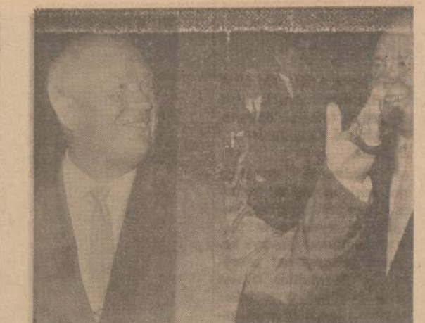
Sovietų premjeras Nikita Chruščiovas į spaudos atstovų klausimą, ar jis dalyvaus visuose posėdžiuose, atsakė: "Kai aš buvau darbininkas, aš savo darbą atlikdavau gerai". Ir lyg tai pabrėždamas, jis mosikuoja rankinį laikrodį, kad štai atvyko į sesiją punktualiai.

Komunistai užsispyrę reikalauja, kad į J. T. būtų priimtas komunistinės Kinijos atstovas. Savo reikalavimą jie dabar remia tuo, kad, nega-