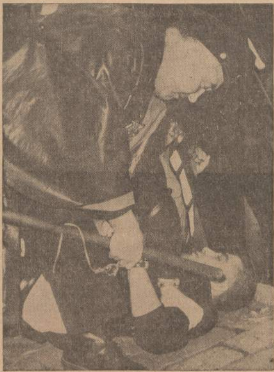
Tvarkos dabotojai prie JT būstinės laiko prispaudė prie žemės demonstrantą. Susirėmimas įvyko, kai komunistų vadai atvyko į JT sesijos atidarymą.