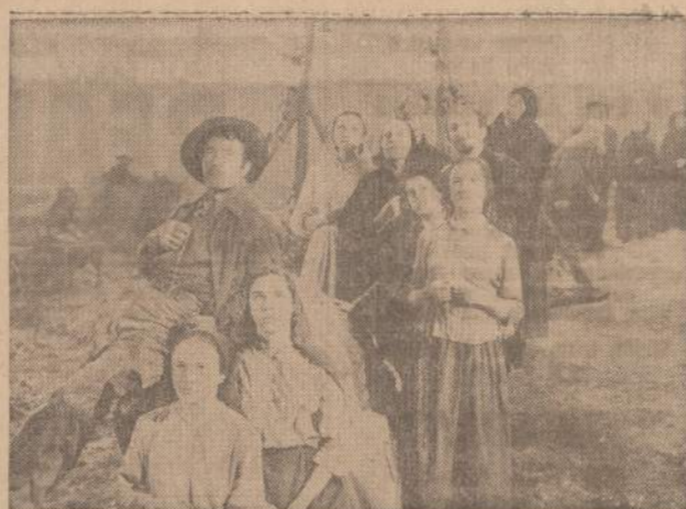
Jaudinančias "Fatimos Stebuklo" momentas, kai portugalai šokinėja, keturiu piemenėlių vedami, linkia švenčiausios Panelės pasirodymo Fatimoje, Portugalijoje. Filma "Fatimos Stebuklas" pradės rodyti trečiadienį, rugsėjo 28 d. Cinesstage Theatre, Dearborn St. & Lake. Paveiklio kairėje garsus aktorius Gilbert Roland, turįs vieną iš svarbiausių ralių "Fatimos Stebukle".

— Šis "piliėtis" "Naujienu" dienraščio neskaityti, — jis skaito tik pinigus. — — "Naujienas" skaito kiekvienas susipraęs lietuvis. O ar Tamsta skaitai? — Jei ne, tai tuojau jas užsisakyk.