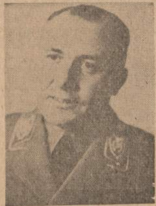
Argentinios policija suėmė itariama smerti, kurs yra labai panašus į Hitlerio karo metų padėjėją Martina Bormanną (matomas vaizdelyje). Bormann yra Nuerembergo teismo už akių nuteistas pakarti. Vėlesnėmis žiniomis, Argentinios tardytojai pradeda abejoti, kad jų suimtasis asmuo būtų Bormann.