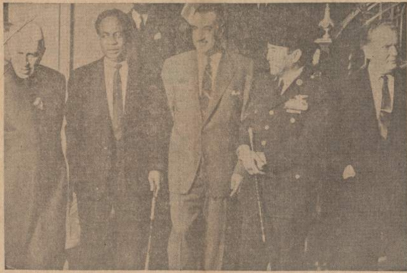
Penkių neutralių valstybių "viršūnių konferencija" Jungtinėse Tautose New Yorke. Iš kairės dešinėn: Indijos Nehru, Ghanos Nkrumah, Jungtinės Arabų Respublikos Nasseris, Indonezijos Sukarno ir Jugoslavijos Tito. Po savo konferencijos visi "penki neutralieji" kreipėsi į prezidentą Eisenhowerį ir sovietų Nikitą, kad įjėdu pradėtų kalbėti.

Naciai iki karo pabaigos pagamino kacete už $646 mil. klavstų pinigų. Pinigų padirbėjai — kaliniai turėjo būti sušaudyti, bet juos išgelbėjo JAV armija.