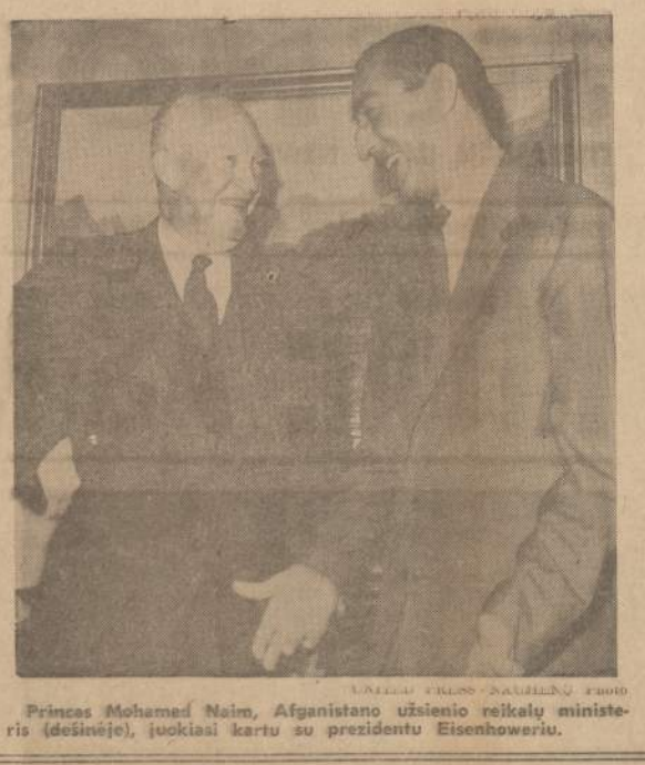
Princas Mohamed Naim, Afganistano užsienio reikalų ministras (dešinėje), juokiasi kartu su prezidentu Eisenhoweriu.

Pradžioje atėidavo linksmos žinios iš Mandžiurijos, bet vėliau mes įsitikinome, kad japonai duoda rusams į kailį. Gen. Kuropatkinas vieną kartą pasitraukė į "iš anksto paruoštą pozicijas", kita padarė tokį gerai apgalvotą strateginį žingsnį, o jau pusės Mandžiurijos ir neteko. Rusų karo laivai neturėdavo progos prieši salvės paleisti. Japonas juos skandindavo be jokios atodairos.