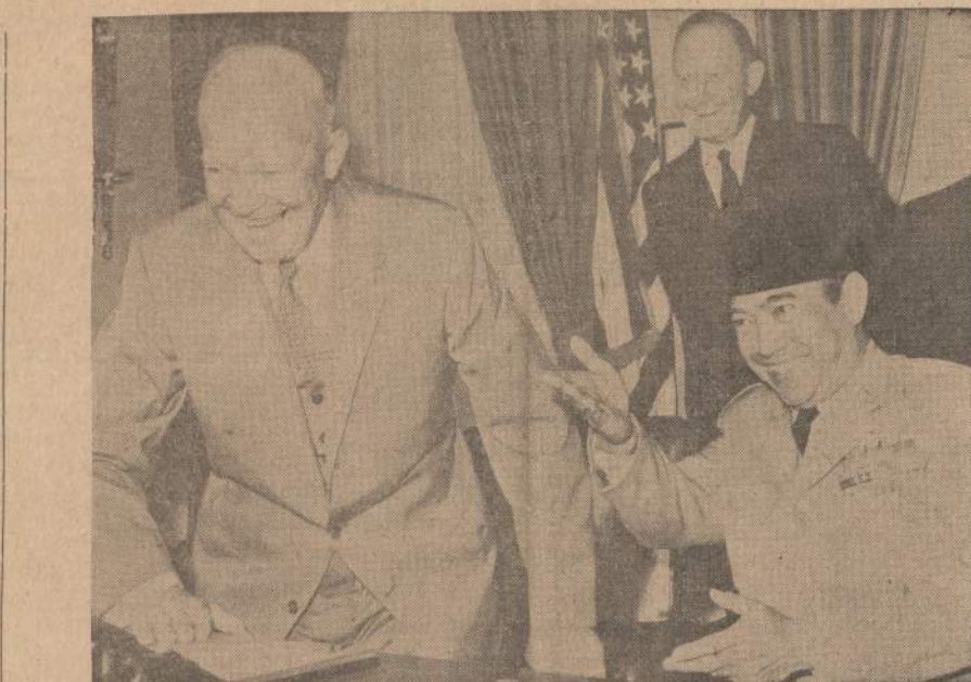
Prezidentas Eisenhoweris ir Indonezijos prezidentas Sukarno juokauja su fotografais po įvykių konferencijos Baltuosiuose rūmuose. Sukarno, vienas iš penkių vadinamųjų "neutralistų" vadų, kurie Jungtinėms Tautoms pasiūlė rezoliuciją, kad Eisenhoweris ir Chruščiovas turėtų susitikti konferencijai, dar ir dabar mano, jog tokia konferencija yra reikalinga.

Klaidos, kurias darė JAV vyriausybė Kuboj, matomos ir daugely kitų Lotynų Amerikos respublikų, pasakė Kennedy. Viena iš tokių nedovanotųjų klaidų yra diktatorių rėmimas. Amerikos vyriausybė rėmėsi Kubos diktatorių gen. Batistą ir po to, kai jo valdžios natūra buvo visiems gerai išaiškėjusi.