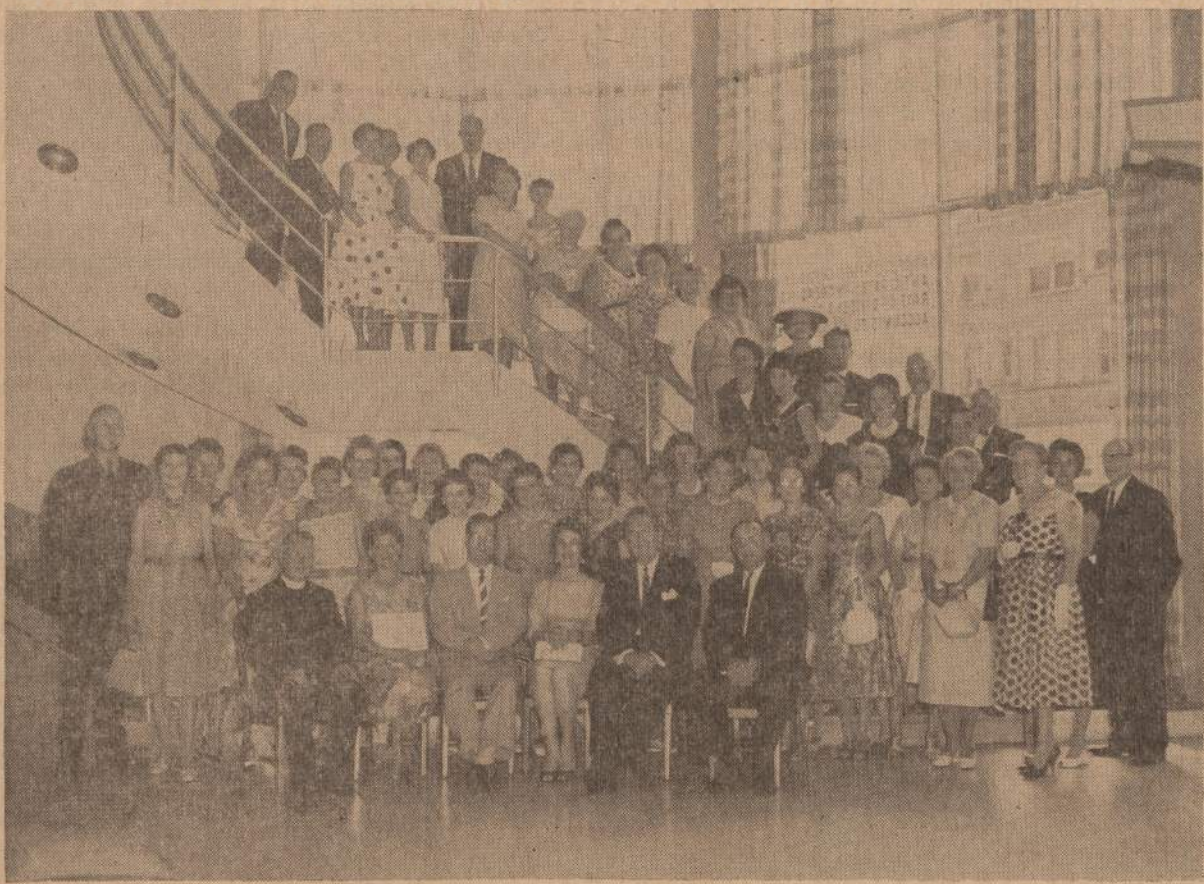
Fotografijoje matome Saugaus Eismo Komiteto (Traffic Safety Committee) vaikus sukvietus šimta saugaus gatvės perėjimo sargu. Šis susirinkimas vyko CHICAGO SAVINGS &