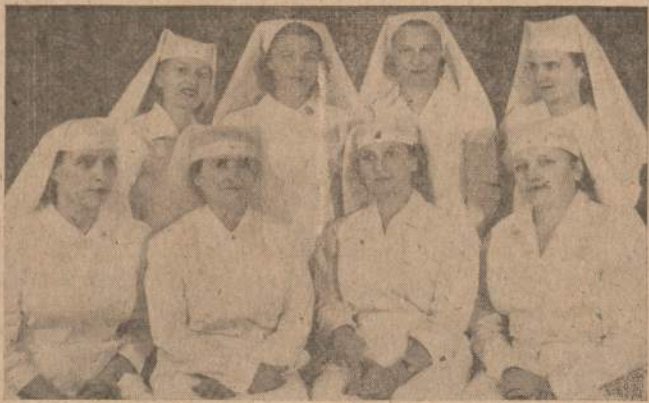
Lietuvos gailestingų seserys, 1950 m. gegužį 13 dieną atgaivinusios savo draugiją Chicagoje, o dabar, šių metų spalio 15 dieną, 8 val. vakaro, Western Ballroom salėje, 3504 S. Western Ave., vėl ruošia koncertą - balį.