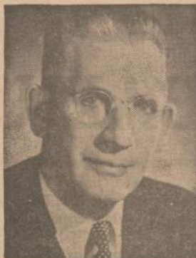
Sen. Paul H. Douglas