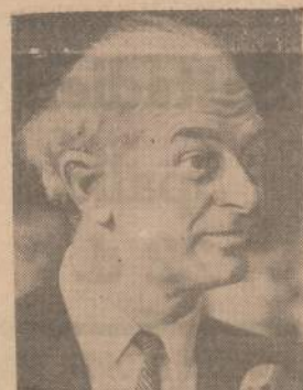
Dr. Linus Pauling, išgarsėjęs chemikas ir Nobelio dovanos laimėtojas, buvo vėl pašauktas senato vidaus saugumo pakomitejo. Ir šį kartą jis atsiskakė pasakyti, kas jam padėjo surinkti 50 tautų mokslininkų parašus peticijai, kad būtų uždraustas branduolinių ginklų bandymas.

Dalyvaujant abiem tėvams (tėvams ir motinoms), bus pro-ga pasitarti ir su mokyklos mo-kytojomis dėl savo vaikų moks-