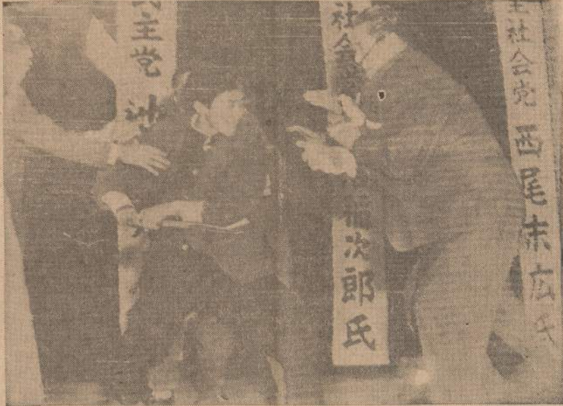
Futaya Yagamaguchi, 17 metų amžiaus jaunuolė, kuris kardu mirtinai subadė Japonijos socialistų vada Inejiro Asanumą (dešinėje) politiniame mitinge. Dėl tos žmogudystės Japonijos sostinėje Tokyo prasidėjo demonstracijos.

LEOPOLDVILLE, Kongas. — Nuverstojio premjero Lumumbos šalininkai, saugomi JT kareivių, svaidė akmenis į pravažiuojančius ar praeinančius baltuosius piliečius. Lumubininkai padrasėjo, kai JT vadovybė praneša, kad jų vadovė negalima areštuoti, kol parlamentas nėra atšaukęs imuniteto. Gį parlamentas išvaikė štabo viršininkas Mobutu, Lumumbos priešas.