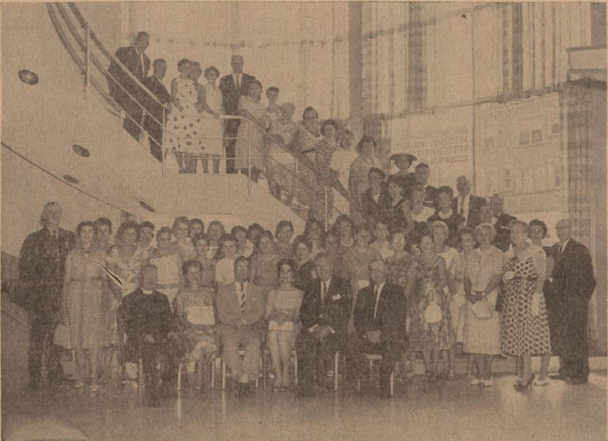
Fotografijoje matome Saugaus Eismo Komiteto (Traffic Safety Committee) važiama sukvietus šimta saugaus gatvės perėjimo sargų. Šis susirinkimas vyko CHICAGO SAVINGS & LOAN ASSOCIATION patalpose, esančiose 6243 S. Western Avenue, kurias vietos organizacijos be jokio mokesčio gali naudoti savo susirinkimams ir ruošiamoms užkandims.