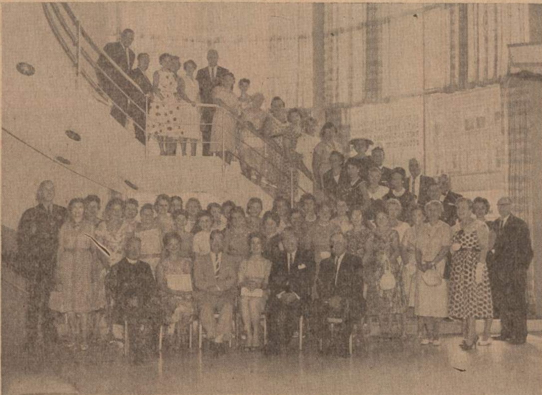
Fotografijoje matoma Saugaus Eismo Komiteto (Traffic Safety Committee) vaisėms sukvietus šimta saugaus gatvės perėjimo sargų. Šis susirinkimas vyko CHICAGO SAVINGS & LOAN ASSOCIATION patalpose, esančiose 6243 S. Western Avenue, kurias vietos organizacijos be jokio mokesčio gali naudoti savo susirinkimams ir ruošiamoms užkandoms.

Chicago Savings & Loan Association 6245 SO. WESTERN AVE. GROvehill 6-7575 CHICAGO, ILL.