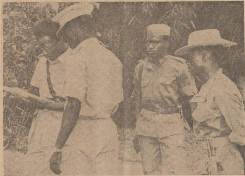
Pulkininkas Joseph Mobutu (kairėje) tariais su ginkluotų jėgų vadais netoli Leopoldville. Vienu laiku atrodė, kad Mobutu pasidarys Kongo respublikos valdovu. Tačiau jo įtaka susilpnėjo ir Konge vėl išaučia chaosas.

Penki ar šeši Kubos kariniai lėktuvai (transportiniai, naikintuvai ir dviejų motorų bombonešiai) buvo pastebėti naujai uždarytais JAV aviacijos ženklais praeitį savaitę San Antonio de las Banos aerodrome, netoli Havanos.