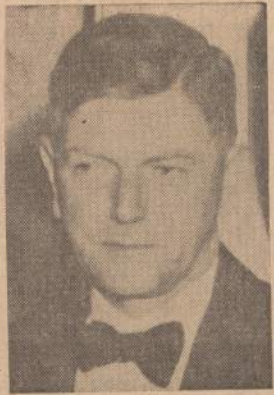
Australietis Frank MacFarlane Burnet (ši nuotrauka imta 1952 m.), kuris laimėjo Nobelio premiją už mediciną kartu su anglų mokslininku Peter Bryan Medawar.