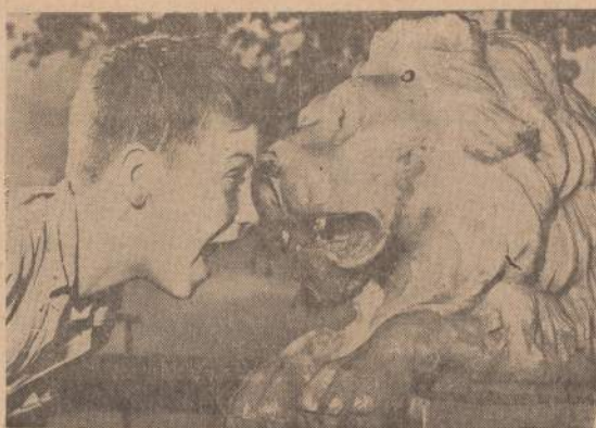
Bellevue (Iowa) parke nuo senų laikų stovi ornamentinis liūtas, su kuriuo paugliai dažnai špūsus krečia, kaip matyti ir iš šios nuotraukos.

Kas liečia lietuvių socialistų kelių Kanadoj — tai kalbėjo manymu, reikia tiesiog stebėtis, kad ta neskaitlinga grupė yra vienintelė lietuviška srovė, kuri, kaip jau buvo eilės dalyvių pažymėta, sugebėjo pasireikšti šio krašto visuomeniškame-politiškame gyvenime įsijungiant į Kanados socialistinį-demokratišką sąjūdį, siekiantį socialinio teisingumo ir šio krašto šviesesnės ateities. Tas faktas, kad