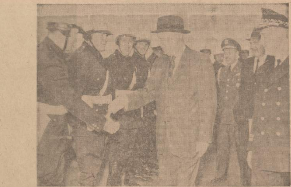
Prieš išskridamas iš San Francisco į San Diego, Cal., prezidentas Eisenhoweris asmeniškai padėkojo ji saugojusiai policijai.

„Klemensas IV ir kt. garbingosios Marijos Teutonų ordino magistrui ir broliams Prūsijoje. Kada iš mūsų prašoma to, kas teisinga ir t. t., visada tebūna įvykdomas. Jūsų mums pateiktas prašymas buvo tokio turinio: Brangiausias Kristuje mūsų sūnus, O (tokaras), kilnis Bohemijos karalius,