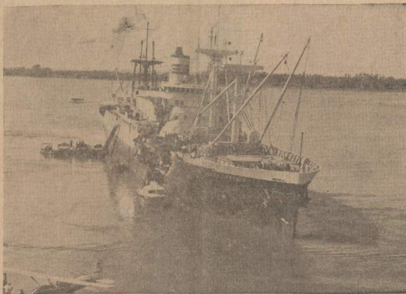
Alcoa-Corsair laivas, su skyje žone, susidūrė su italy laivu Mississippi upėje netoli Empire, La. Aštuoni asmenys buvo užmušti. Sužeistų skaičius buvo daug didesnis. Italy laivas buvo Lorenzo Marcello, iš Venecijos.

Pasidarius Vokietijoje ankšta (ten yra tūkstančiai JAV, Anglijos kareivių), Vokietija pirmą kreipėsi į Ispaniją. Kilus nepasitenkinimui Nato sąjungoje, De Gaulle tuoj pakvietė vokiečių kareivius mokytis prancūzų teritorijoje. Vokietija kraus Prancūzijoje ir kai kurių ginklų atsargas.