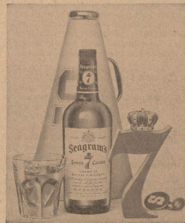
Po viso dienos triukšmo negali būti nieko geresnio, kaip malonaus ir gero skonio 7 Crown TARK SEAGRAM'S IR BŪK TIKRAS BLENDED WHISKY, 66 PROOF, 65% GRAIN NEUTRAL SPIRITS. SEAGRAM-DISTILLERS COMPANY, NEW YORK CITY.