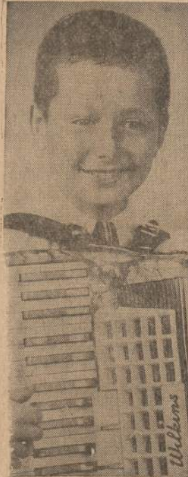
Berniukai ir mergaitės išmoks gražiai groti akordeonu, jei mokysis Wilkins School of Music mokykloje, esančioje 4853 Milwaukee Ave., arba 3404 Fullerton Ave. Galima susitefonuoti EV 4-4800. Gausite lengvatą, jei pasakysite, kad mokyklos adresą patyrėte iš šio dienraščio.