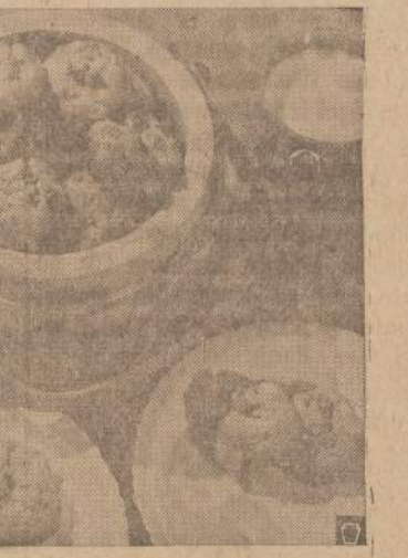
Date Peanut Butter Drop cookies and mugs of chilled milk make a mighty good snack for hungry youngsters just home from school.

MOKAM AUKŠTUS DIVIDENDUS VISOMS TAUPYMO SASKAITOMS Indėliai apdrausti iki $10,000.00 Duodame paskolas už namus nuo vienerių iki dvidešimties metų lengvais mėnesiniais išmokėjimais. BRIGHTON SAVINGS AND LOAN ASS'N. 4071 ARCHER AVENUE, CHICAGO, ILL. LAFayette 3-8248 Sekretorius CHARLES ZEKAS Valandos: Kasdien nuo 9 ryto iki 4:30 po pietų. Ketvirtadieniais nuo 9 ryto iki 8 val. vakaro. Trečiadieniais uždaryta.