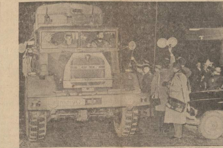
Vakarų Vokietijos armijos sunkvežimiai įvažiuoja į Prancūzijos teritoriją, gabendami kariuomenę. Pagal susitarimą vokiečių kariuomenė bus treniruojama Prancūzijoje.

Julius Rosenberg, gavo tik 15 metų. Špionažo metais (1945) Greenglass dirbo mašinistu kaip armijos puskarininkis Los Alamos, N. M., laboratorijoje. Ten JT brigados kareivis iš Ganos, Gvinėjos, JT turėtų juos atšaukti atominę bombą.