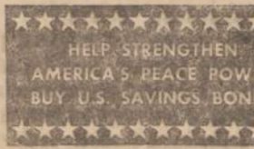
HELP STRENGTHEN AMERICA'S PEACE POWER BUY U.S. SAVINGS BONDS

Dar po kelių pasitarimų buvo baigtas posėdis ir malonioje nuotaikoje pasivažiavinta kavute ir pica. Sekantis susirinkimas bus lapkričio 3 d., 10:30 vakaro toje pačioje vietoje. C. K.