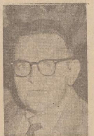
Atomis šnipas David Greenglass, 38 metų, brolis Ethel Rosenberg, kuri su savo vyru Julius Rosenbergu buvo nubausti mirtimi už šnipinėjimą sovietų naudai. Greenglass buvo nušautas 15 metų kalėjimo ir atsidėjęs 9 metus ir 4 mėnesius, paleidžiamas į laisvę.