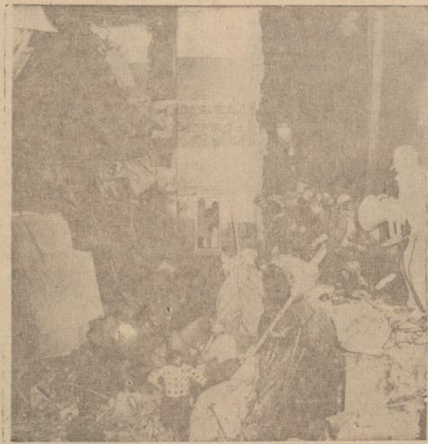
Windsore, Ont., Kanadoje, įvykus sprogimui didesnę departamentinėje krautuvėje, 8 žmonės buvo užmušti ir daugiau kaip 65 sužeisti. Vaidze gelbėjimo darbininkai ieško krautuvės griuvėsiuose daugiau žmonių kūnų.

Mums tėvukas pasakodavo, kaip buvo Lenkijos karas su rusais ir lenkai pralaimėjo, tai lietuvius paliuosavę iš baudžiaivos, bet nežilgo lenkai pradėję lietuvius kalbinti, girdi, dabar mes visi esame katalikai, visi dabar lygūs, štai ir panelės su mu-