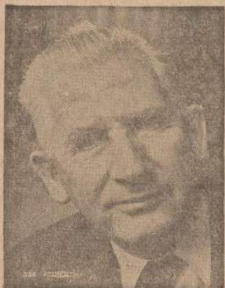
Sen. Paul H. Douglas