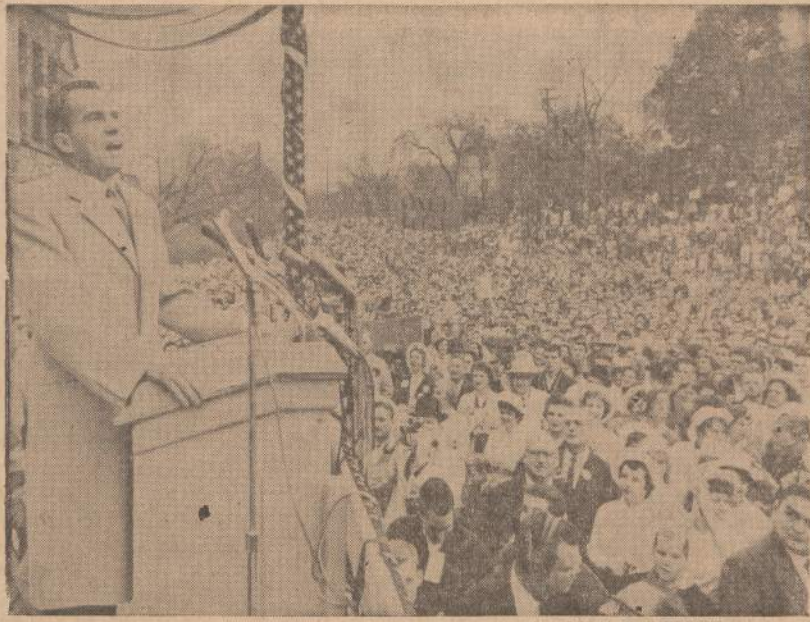
Viceprezidentas Richard Nixon kalba 12,000 žmonių miniai Ann Arbor (Mich.) mieste.

Faktiniu požiūriu tokia teisė — teisė atsiskirti — yra, žinoma, be jokios prasmės karistiškai okupuotame ir diktatoriškai valdomame krašte, kuriame gyventojai neturi jokių priemonių pareikšti savo nusistatymą ir savo valią. Kai 1936 metais, netrukus po vadinamosios Stalino konstitucijos, kurioje toks nuostatas yra įrašytas, paskelbimo, vienas Amerikos žurnalistas paklausė Stalino, ar iš tikrųjų sovietinės respublikos gali išėiti iš Sąjungos, jis atsakė: "pust poprobu-