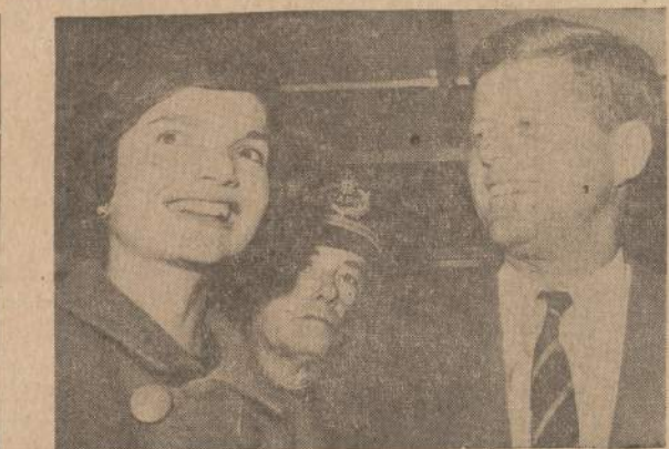
Sen John F. Kennedy ir jo žmona Jacqueline apleidžia balsavimo vietą Bostone. Iš ten jie išvyko į savo vasarnamį, kuris yra Hyannis Fort, Mass., kur laukė pranešimų apie rinkimų rezultatus.

Rika atsiklaustų Anglijos vyriausybės, pavyzdžiui, ar povandeninis atominis laivas, kurio bazė yra Skotijoje, bet kuris operuoja Ledinuotajame vandenyne, gali paleisti į darbą Polaris raketas.