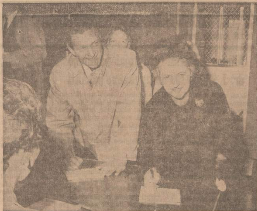
Demokratų kandidatas j Illinois valstijos gubernatorių, Otto Kerner, ir jo žmona Helen buvo vieni pirmųjų, kurie atvyko balsuoti j Glenview, Ill. Jis rinkimus laimėjo ir bus naujas Illinois gubernatorius.