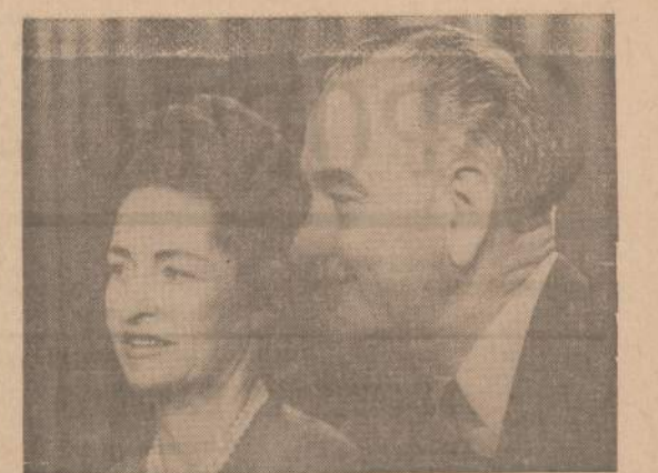
Naujai išrinktas viceprezidentas Lyndon B. Johnson ir jo žmona, Lady Vyrė. Austin, Tex. Susirinkusiems bendradarbiams ir rėmėjams Lyndon Johnson reiskia savo padėką.