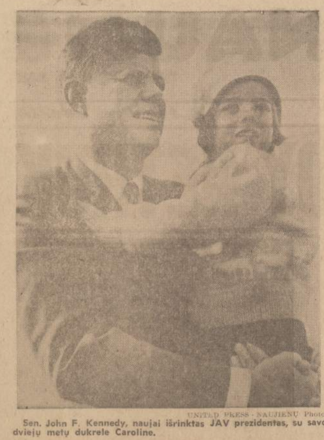
Sen. John F. Kennedy, naujai išrinktas JAV prezidentas, su savo dviem metų dukrele Caroline.

dai interpretuojama. Plačiau apie ją kalbėti negaliu, nes pats negirdėjau, o kiti pasakojo tik vieną kitą detalę. Plačiau galiu papasakoti tik apie 3 valandas užtrukusį banketą St. Clement salėje, neskaitant po jo sekusių šokių, kuriame turėjau progą dalyvauti.