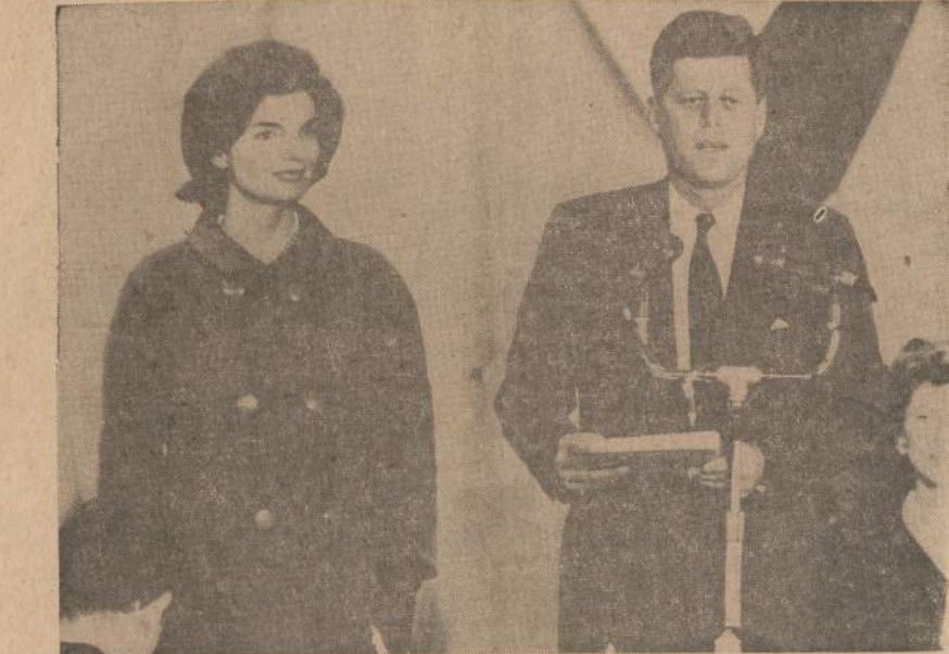
Naujai išrinktas JAV prezidentas John F. Kennedy sako kalbą tuoj po to, kai oficialiai buvo patvirtintas jo išrinkimas. Kalbą savo pasekėjams jis pasakė National Guard Armory patalpose, Hyannis, Mass. Šalia jo buvo jo žmona Jacqueline.

HAVANA. — Fidel Castro didžiavosi — masiniame mitingų sporto rūmuose, esą jam pasisekė diplomatinėmis priemonėmis sulaukyti Ameriką nuo užpuolimo prieš Kubą. Bet invazijos pavojus, kad ir ne toks didelis, kaip pastarosiomis savaitėmis, liks ilgiam laikams. Dėlto kubiečiai turį apsiprasti su dabartiniu gyvenimu — nuolat budėti ir būti apsiginklavusiems, kalbėjo diktatorius.