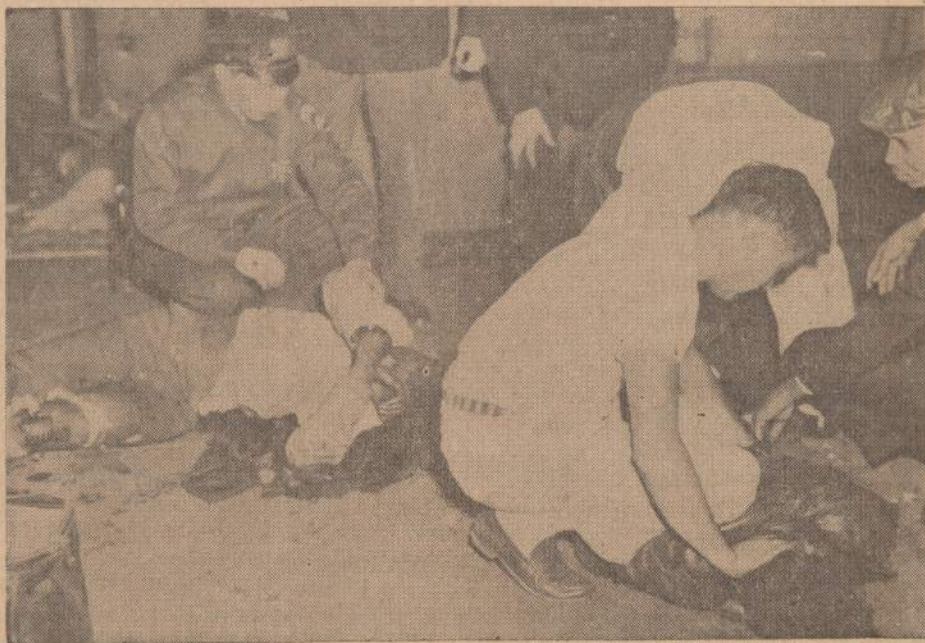
New Yorko požeminiame kelyje vėl buvo išsprogdinta bomba keleiviniame vagonė. Viena mergaitė buvo užmušta. Sužeistų skaičius siekia 16. Kai kurie sužeisti gana sunkiai. Sužeistiesiems yra teikiama pirmoji pagalba. Požeminiame kelyje jau kelinta bomba yra išsprogdinama. Manoma, kad tai kokio pakvaišėlio darbas.

Kitataučiai (bent pas mus Rockforde) noriai dalyvauja lietuvių pokyliuose, nes jie žino,