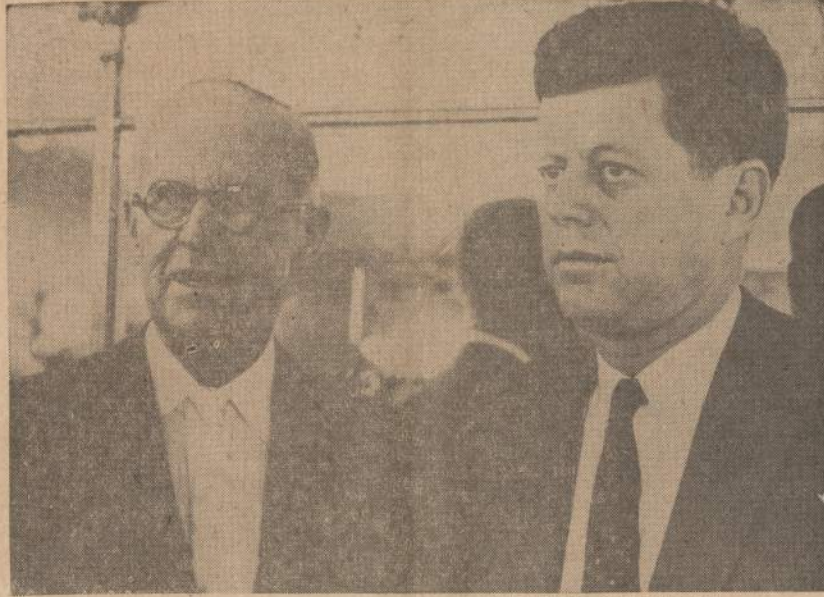
Naujai išrinktas prezidentas John F. Kennedy (dešinėje) su savo tėvu, Joseph F. Kennedy, kuris yra 71 metų amžiaus ir savo laiką buvo Amerikos ambasadorius Anglijai.

Brandt patenkintas Kennedžiu BERLYNAS. — Vakarų Berlyno meras socialistas Willy Brandt, kalbėdamas per radiją pareiškė, kad Kennedžio išrinkimas į JAV prezidentus yra gera žinia berlyniečiams. Jis mano, kad dabar Vakarai parodys didesnę iniciatyvą ir ryžtumą. Brandt yra Vokietijos socialdemokratų kandidatas į kanclerius (ministerius pirmininkus).