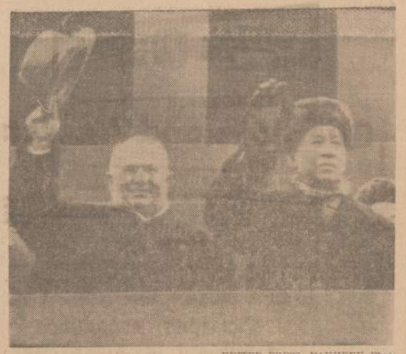
Sovietų premjeras Chruščiovas (kairėje) ir Liu Chao-Chi, komunistinės Kinijos prezidentas, stovi viršuje Lenino - Stalino mauzoliejaus ir žiūri į 43-jų metų komunistinės revoliucijos sukakties minėjimo paradą.