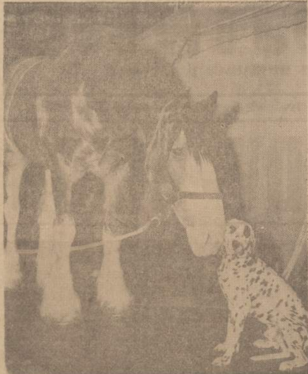
Budweiser čempionas "Sailor", sverias 2,300 svaru, New Yorko miesto arklių parodoje. "Sailor" priklauso Anheuser-Bush bravorui, kuris yra St. Louis, Mo.

Pagal jų davinius, dar 20,000 vokiečių kilmės asmenų yra su-