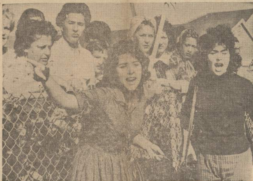
Dvi pauglės prie William Franiz pradžios mokyklos New Orleans mieste rečia policijos adresu. Vėliau jos reporteriams pareiškė, kad negrį mokiniai jas išeidė. Kaip žinia, New Orleans integracijos priešininkai yra labai sujudę ir visais būdais stengiasi nepriesti, kad į baltaodžių vaikams skiriamas mokyklas būtų priimti negrų vaikai.

Mergina buvo atgabenta į ligoninę iš Gilbert, Minn., sutrikusiais nervais. Kapelionas išprašė gydytoją leisti jam paminti pacientę pasivažinėti automobiliu. Kaip išvažiavo, taip ir negrįžo.