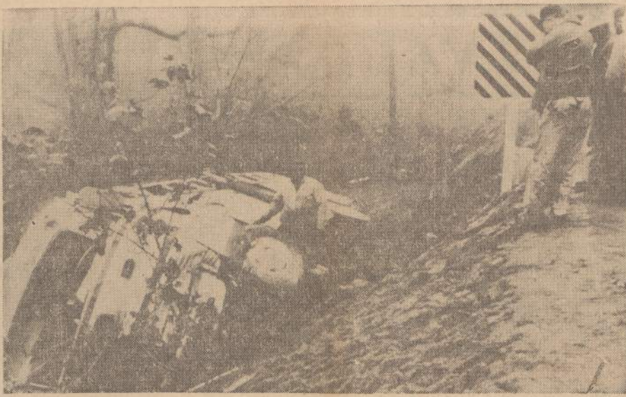
Dėl miglos autobusas, vežęs 40 karių, nusirito nuo kelio į upelį netoli Smithfield, Va. Kiek jau žinoma, trys keleiviai buvo sunkiai sužeisti.

SKAITYK PATS IR PARAGINK KITOS SKAITYTI NAUJIENAS JOS VISAD RAŠO TEISYBĘ