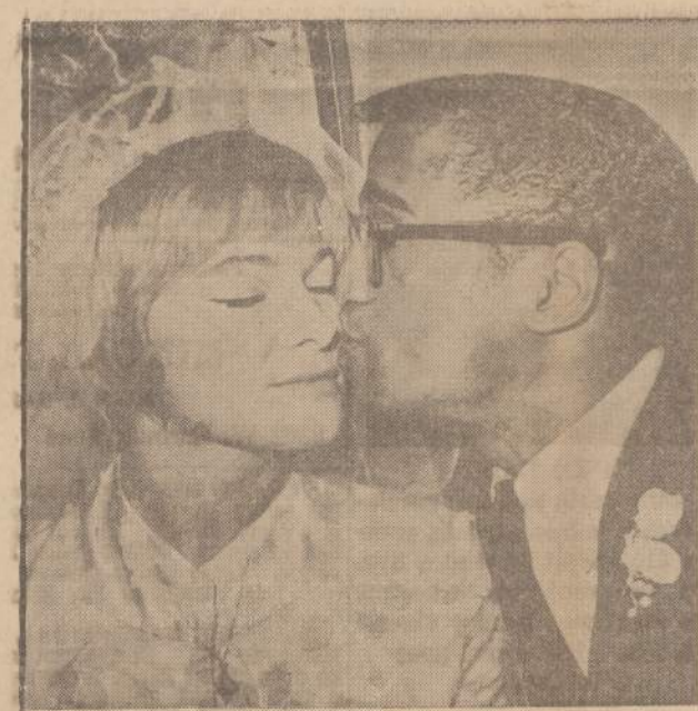
Sammy Davis bučiuoja švedų kilmės aktorę, May Britt, po sutuoktinių ceremonijų žydų sinagogoje, Hollywood, Calif.

BUY U.S. SAVINGS BONDS WHERE YOU BANK OR WORK