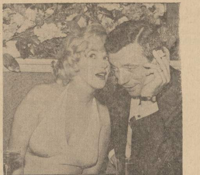
Marilyn Monroe paskelbė New York, kad ji skiriasi su savo vyru, Arthur Miller. Skleidžiami gandai, kad tarp Monroe ir prancūzų aktorius Yves Montano (čia ji šnabzdasi su juo viename New Yorko pobūvyje) užsimęzė romansą. Monroe ir Montano yra pasižymėję kino aktoriai.

WORLD PARCEL SERVICE, 3320 SO. HALSTED ST., CHICAGO, ILL. Tel.: YA 7-0677 Paskambinkite telefonu, atvešime Jus ir siuntinį nemokamai.