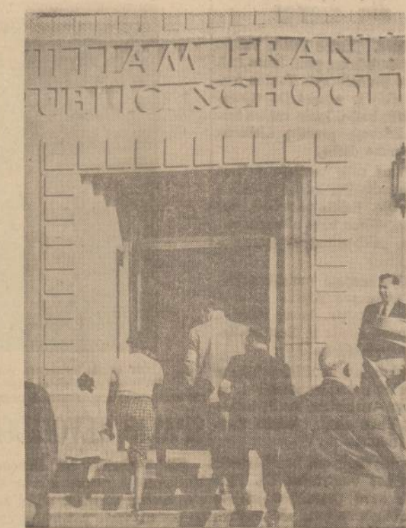
JAV maršalų lydimas, negrė veda savo dukterį į ankščiau buvusią vien tik baltųjų vaikams William Frantz pradžios mokyklą New Orleans mieste. Federalinis teismas patvarkė, kad negrų vaikai turi būti priimami į baltųjų vaikams skirtas mokyklas.

Be to, kas dar svarbiau, pagal republikonų įvestą planą pagelbos teikimas ligoniams priklausys nuo paskirų steitųjų geros valios. Antra, kad žmogus tą pagalbą gautų, jį turi padaryti pareiškimą po priėjimo, kad jį neturi jokio turto — nei namo, nei santaupų banko — žodžiu, kad jį turi pavargėlis ("pauper"); ir jį