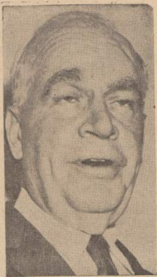
Naujai išrinktas prezidentas John F. Kennedy jau pradėjo sudarinėti savo kabineto narius, paskirdamas North Carolina valstybės gubernatorių, Luther H. Hodges, prekybos sekretoriumi. Tiesa, žinios apie tą paskyrimą nėra oficialios.

Laukimas, kad štai automobilis bile minutę sustos, buvo tikrai kamuojantis. Ir koks mūsų buvo džiaugsmas, kai pamatėme kelis geso tankus. Buvome tikri, kad netoli kur bus ir gazolino stotis. Ir tikrai netrukus stotį privažiavome. Ir