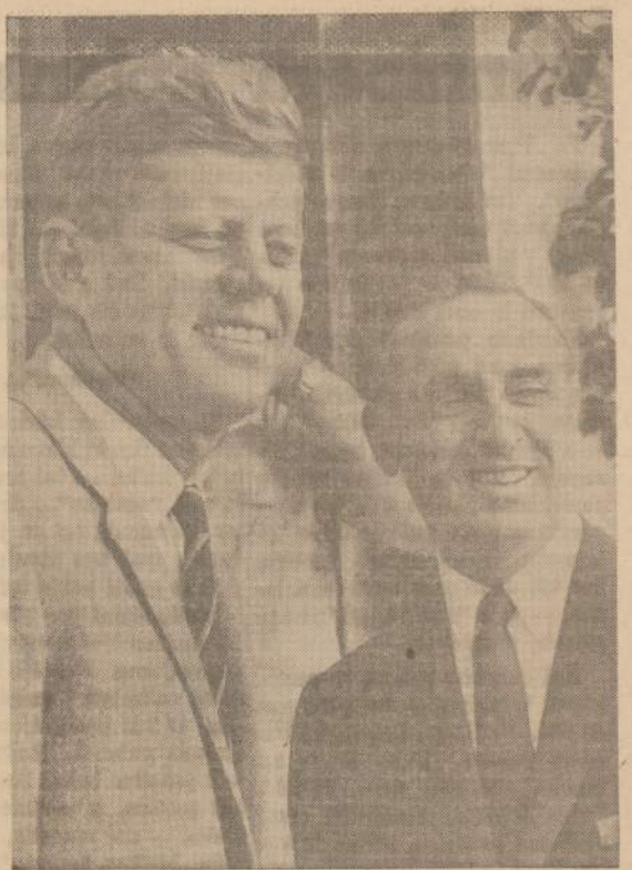
Naujai išrinktas JAV prezidentas John F. Kennedy ir Conn. gubernatorius Abraham Ribicoff, kuris daug prisidėjo prie Kennedy išrinkimo.

Ima sovietų rublius tik Rusijos satelitai. Bet ką jie darys