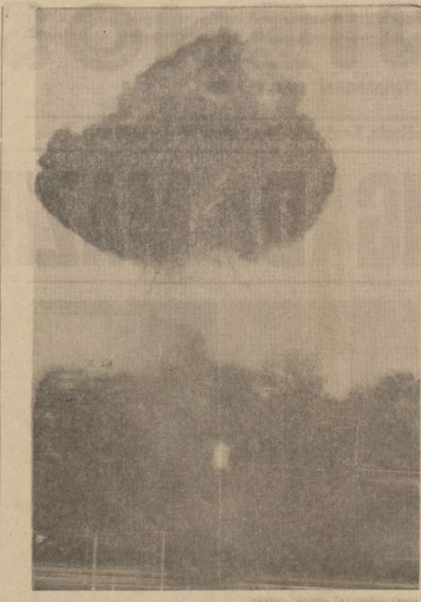
Simultonių atominės bombos sprogdinimas prie Fort Meyer, Va., Tokios demonstracijos bus atliktos ir kitur.