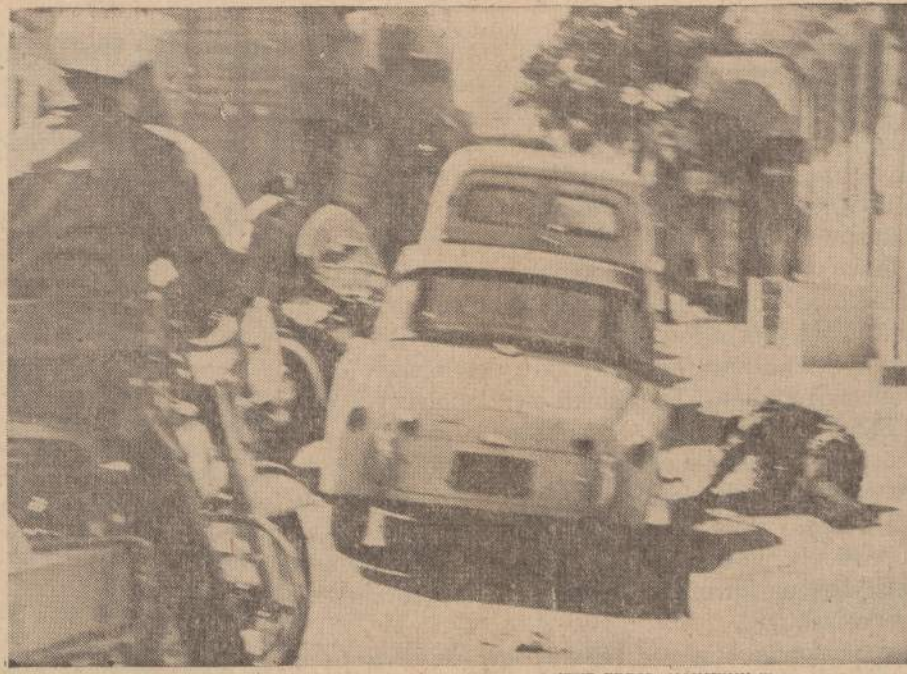
New Orleans (La.) gatvėje buvo policijos nušautas neegras, kai jis pradėjo švaistytis su peiliu. Neegras sužeidė peiliu šešių metų berniuką ir bandė pulti kitus praevius.