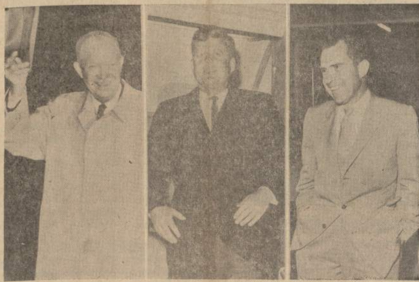
Amerikos "trys didieji". — Prezidentas Eisenhoweris, būsimas prezidentas John Kennedy ir dabartinis viceprezidentas Richard Nixon grįžo iš porinkiminių atostogų į Washingtoną, kur valdžios perteidimas sudaro svarbiausią dienos uždavinį.