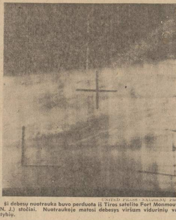
Si debesy nuotrauka buvo perduota iš Tiroso satelito Fort Monmouth (N. J.) stotiai. Nuotraukoje matosi debesy viršum vidurinių valstybių.

SIUNČIAME SIUNTINIUS I LIETUVĄ IR KITUS KRAŠTUS Prieš sudarydami siuntinį, apžiūrėkite pas mus PALTAMS, KOSTIUMAMS, SUKNELEMAMS medžiagas, vitines ir angliškas, RASOMAS, SIUVAMAS mašinas, AKORDEONUS, FOTO aparatus, LAIKRODZIUS ir kitas prekes, kurios tinka siuntimui; jų čia rasite didelį pasirinkimą - nebrangiomis kainomis. 6 KOSTIUMAI (SIUTAI) kainuoja tik $36.- Šios kainos tik trumpam laikui galioja. LIETUVIŲ BENDROVĖ WORLD PARCEL SERVICE, 3320 SO. HALSTED ST., CHICAGO, ILL. Tel.: YÁ 7-0677 Paskambinkite telefonu, atvešime Jus ir siuntinį nemokamai.