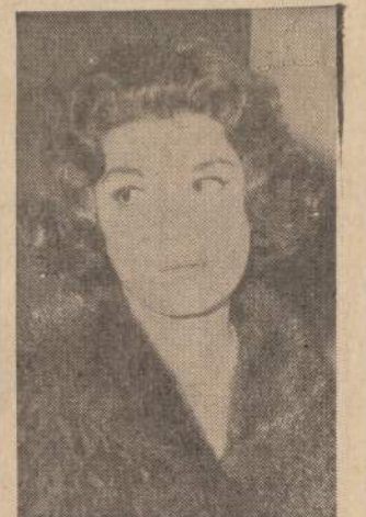
Connie Francis, viena iš labiausiai pagarsėjusių dainininkių, prie New Yorko policijos licencijų (laisvių) biuro pareiškė, jog ji nedalinuosianti garsiame Copacabana naktiniam klube, jei bus reikalaujama, kad būtų padaryti jos pirštų nuospaudai. New Yorke yra toks patvarkymas, kuris reikalauja, kad naktinių klubų linksmintojų (dainininkių, šokėjų ir muzikantų) būtų nuimtos nuotraukos ir pirštų antspaudai.