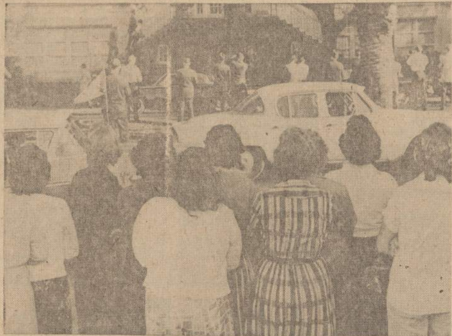
Baltųjų mokinių motinos sustojusios žiūri, kaip neigri mokiniai eina į McDonough pradžios mokyklą New Orleans, La. Antra savaitė kaip juodųjų vaikai lanko integruotą baltųjų mokyklą, kuria baltieji nuo to laiko boikotuoja.