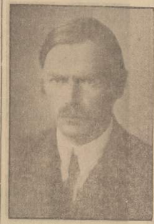
Prof. Steponas Kairys

Žymusis Lietuvos veikėjas veteranas, Lietuvos Nepriklausomybės Akto autorius ir signataras, prof. Steponas Kairys vėl paguldytas ligoninėje, Brooklyne.