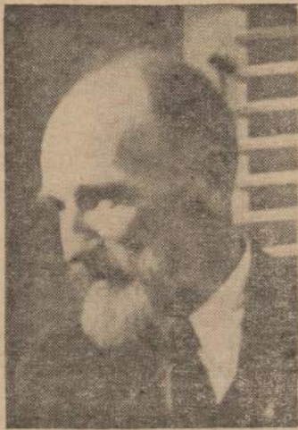
Prof. V. Biržiška

1960 m. lapkričio 27 dieną Lietuvių Tautinėse Kapinėse prie prof. Vaclovo Biržiškos kapo buvo atidengtas juodo švedų marmuro antkapis. Į antkapio atidengimo iškilmes susirinko apie 200 mokslininko draugų, mokinių ir gerbėjų.