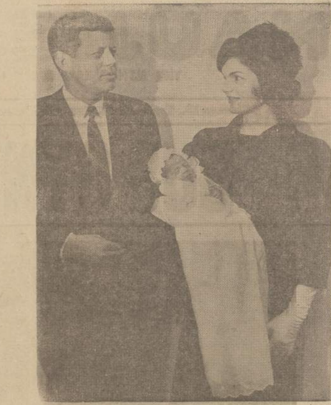
Nausiai išrinktas prezidentas John F. Kennedy ir jo žmona kartu su naujagimiu sūnum tuoj po krikštynų, kurios buvo atliktos Georgetown universiteto ligoninės koplyčioje.

Tad jos veikla domisi ir pabaltiečių stebėtojai. Sekantiems metams numatyta 31.41 mil. dolerių sumata. Šiais metais organizacija padėjo emigruoti artį 100.000 asmenų, kitais metais numatyta 103.000. Organizacija savo veiklą yra išplėčiusi į Artimuosius Rytus. CIME vykdo dar specialią programą finansuoti perkeldinimą išilaviniams techniku į Lotynų Ameriką. Technškai neapmokintų darbo jėgų emigracija į Lotynų Ameriką laikoma netikslu, nepageidaujama žygiu. Tokie emigrantai dažnai tik padaugina skaisčių nepatenkintųjų.