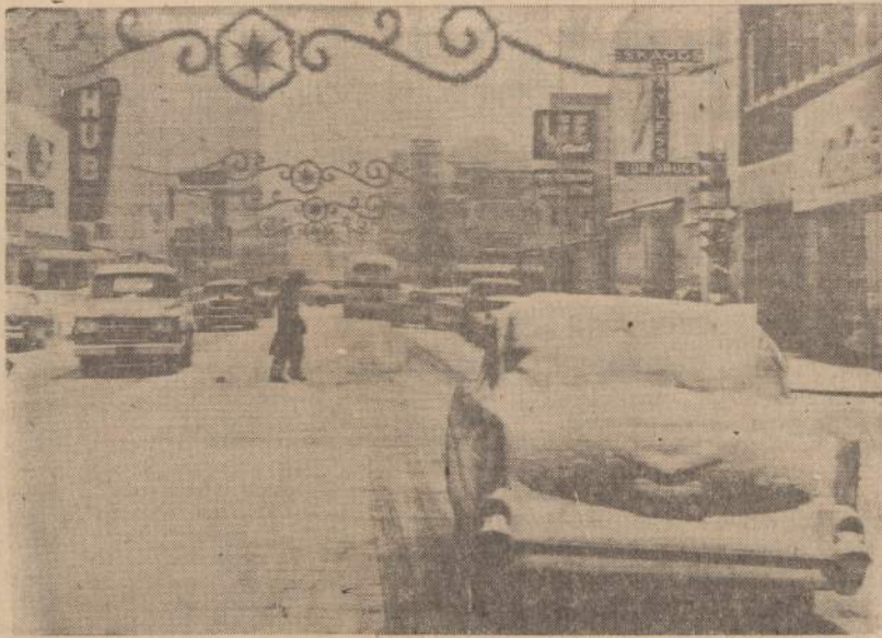
Amarillo, Tex. — Miestas jau "pasipuošė" Ka ledoms, — susilaukė pirmo sniego, kuris automobilistams sudarė daug nemalonumų.

— Gal jūs mano kalbos nesuprantate, tai va štai yra tas žmogus, kurs mano kalbą jums persakys. — toliau kalbėjo karininkas. Tas žmogus tikrai ge-