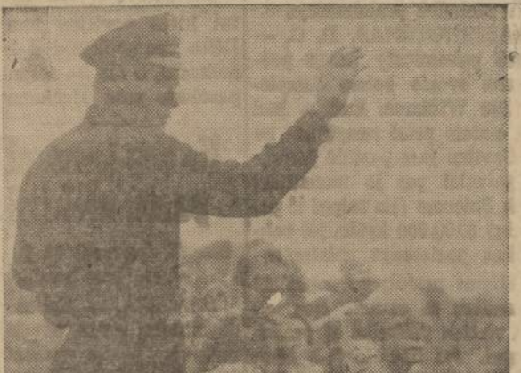
"Here they are again. School's open. But what a job to protect them. It's up to me and the drivers. Most drivers are fine. But there are the ones in a hurry, sneaking by the school bus when the youngsters are running for it, forgetting kids rush into the street from nowhere. They could be brought into line, but it takes real enforcement and a town that really supports it."