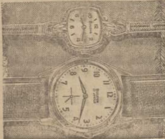
Laikrodėliai Bulova, Bannus, Longines, Elgin. Didelis pasirinkimas ir kainos žemesnės kaip kitur.