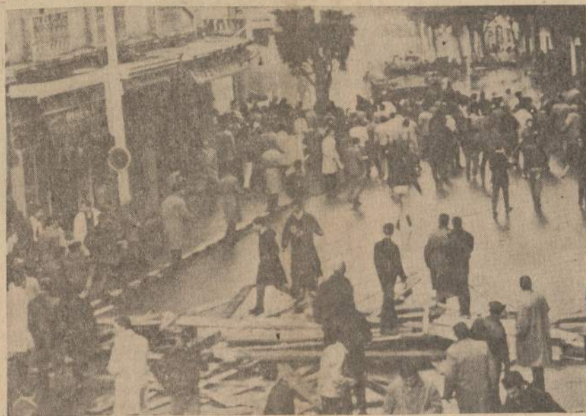
Ryšium su Prancūzijos prezidento De Gaulle atvykimu į Alžirą, prasidėjo daugelyje miestų riaušės. Ši nuotrauka buvo nūmė Algiers mieste, kur tarp kariuomenės ir magometonų įvyko smarkūs susirėmimai. Kiek žinoma, užmuštų skaičius siekia 25.

New Yorke ir apylinkėj iškrito 17-20 inčų sniego, susisiekiamas traukiniais, autobusais, automobiliais buvo nutrauktas, nemaža gyvenviečių izoliuota, žmonės pritrūko maisto, kuro. Mokyklos, nemaža įstaigų ir įmonių turėjo nutraukti darbą New Yorke, Philadelphijoje, Bostone ir kituose rytiniuose miestuose. Žiemos audra ir šalčiai palietė ir tokias pietines valstybes, kaip Texas, Louisiana, bet daugiausia žmonių žuvo New Yorke, Pensilvanijos ir Massachusetts valstybėse. Ten temperatūra buvo iki nulio, o vietomis — dar žemiau.