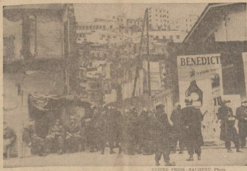
Prancūzų žandarai ir kariuomenė saugo įėjimą į Casbah, Algiers miesto musulmonų gyvenamą vietovę.

Pagerbė "tarybinę konstituciją", kurios niekas nesilaiko. Gruodžio pradžioje sovietinė propaganda Lietuvoje pagerbė "tarybinę konstituciją", kurios tikrovėje niekas nesilaiko, nes konstitucijoje suminėtos piliečių teisės paties režimo nepaisomos. (E)