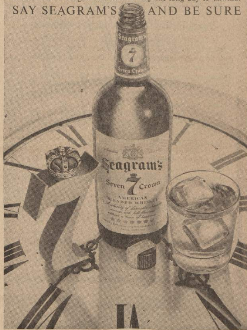
SEAGRAM-DISTILLERS COMPANY, NEW YORK CITY. BLENDED WHISKEY, 60 PROOF, 95% GRAIN NEUTRAL SPIRITS.

Tonight, when the pace finally slackens, let the sure and satisfying smoothness of Seagram's 7 Crown help the long day to unwind. SAY SEAGRAM'S AND BE SURE