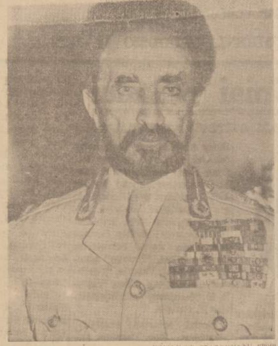
Etiopijos karalius Haile Selassie, kurio valdžia kaip pranešama, buvo nuverstą. Sukitietiai paskelbsią Etiopiją respublika.

Ta viduramžių idėja, kad karališkos kilmės asmenys priklauso kokiam ten "aukštesnei" žmonių veislei, tebėra stipri