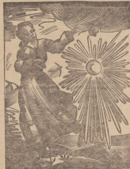
PAULIUS AUGIUS — Mergaitė ir saulė

Instituto narys, tai moderniosios dailės pajėgesniųjų dailininkų kolektyvas.